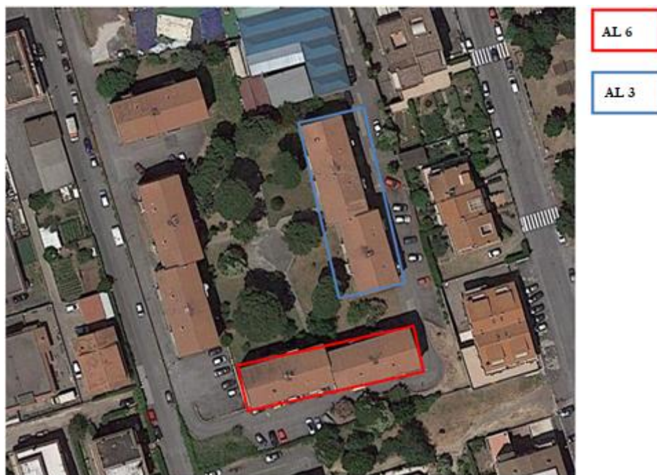
Figura 5. Individuazione delle Tipologie nel Lotto 3 – Comune di Albano Laziale