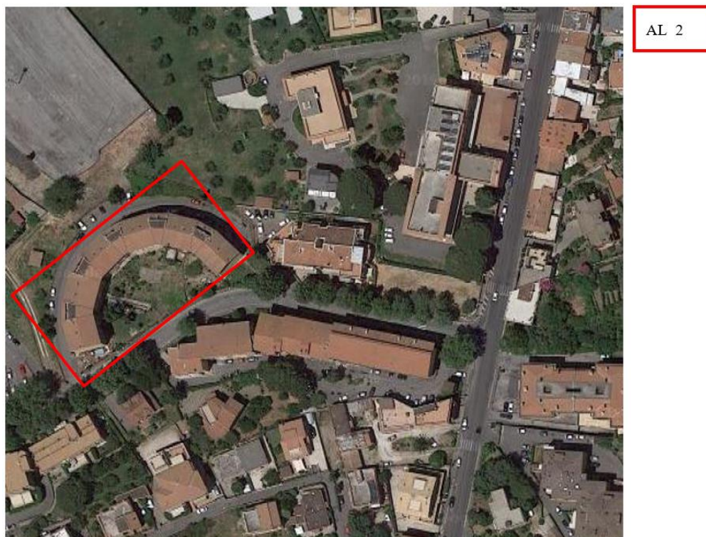
Figura 4. Individuazione delle Tipologie nel Lotto 2 – Comune di Albano Laziale