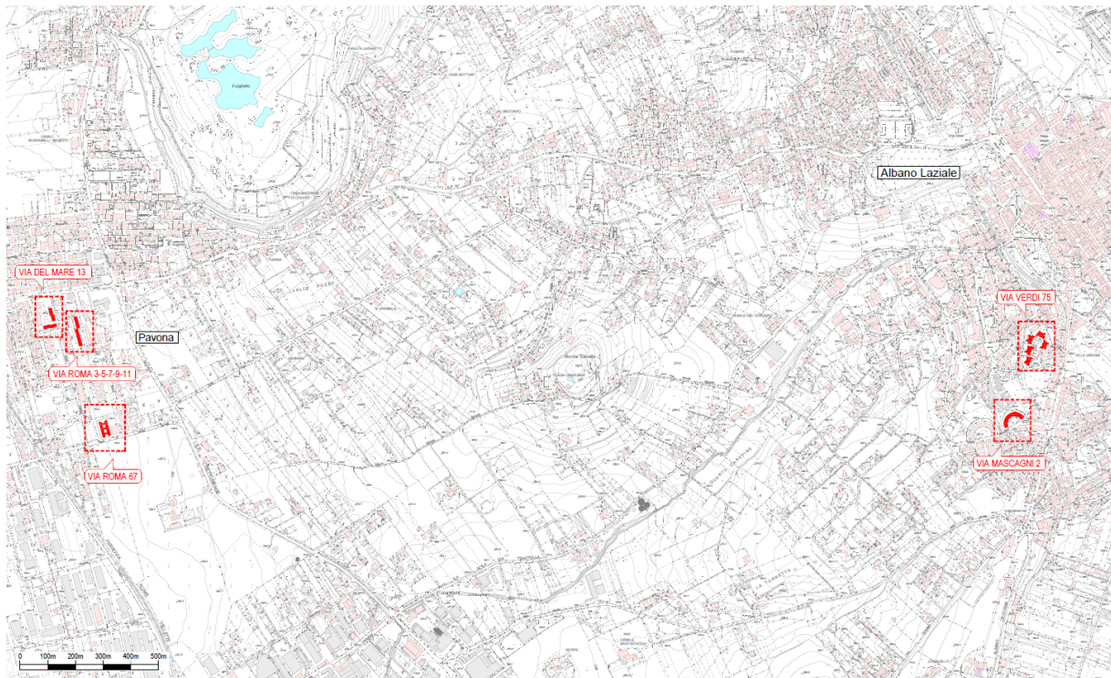
Figura 1. Immobili oggetto di intervento su C.T.R.

Gli immobili gestiti dall'ATER nel Comune di Albano Laziale ed oggetto di intervento sono individuati nella planimetria di seguito riportata