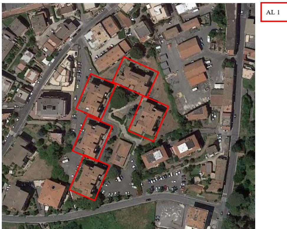
Figura 3. Individuazione delle Tipologie nel Lotto 1 – Comune di Albano Laziale