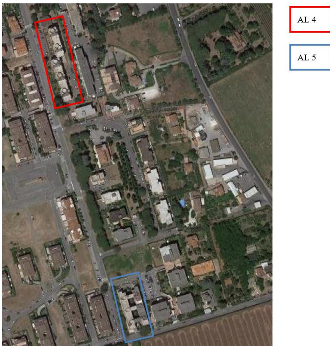
Figura 6. Individuazione delle Tipologie nel Lotto 4 – Comune di Albano Laziale