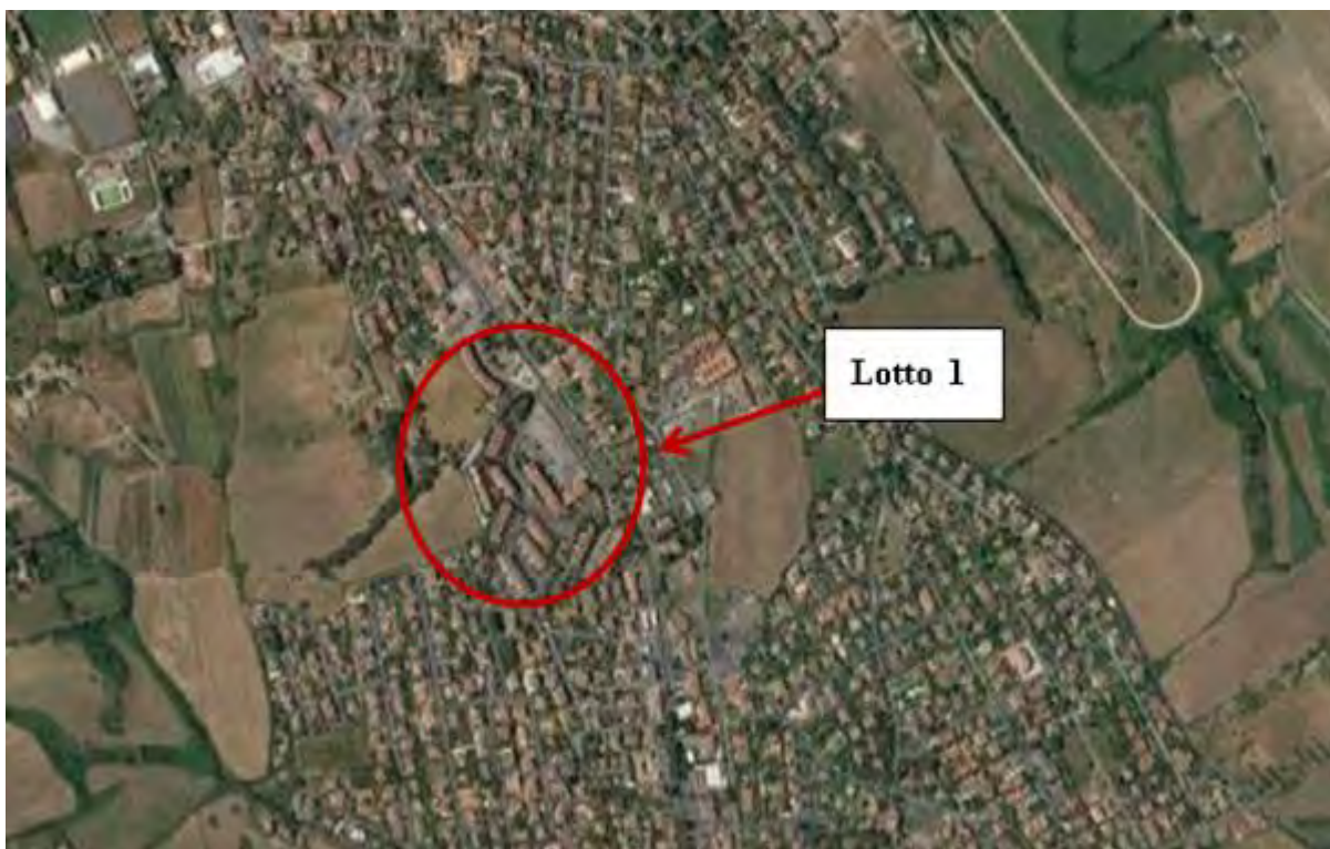
Figura 2. Individuazione dei lotti - Comune di Anguillara Sabazia su foto aerea

Nei paragrafi successivi vengono fornite informazioni più dettagliate relativamente agli immobili e le relative tipologie.