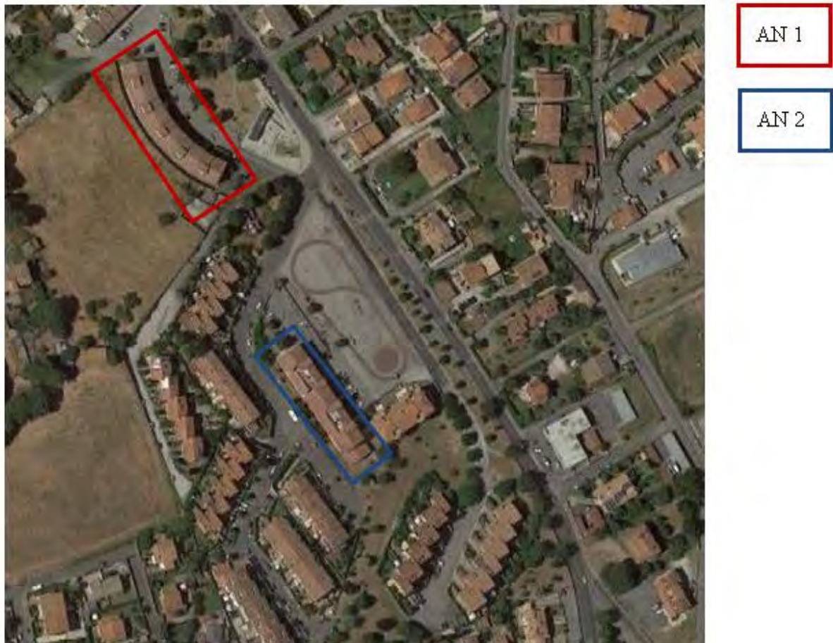
Figura 3. Individuazione delle Tipologie nel Lotto 1 – Comune di Anguillara Sabazia

Si riportano di seguito le immagini aeree con evidenziazione dell'ubicazione planimetrica delle tipologie individuate al paragrafo precedente: