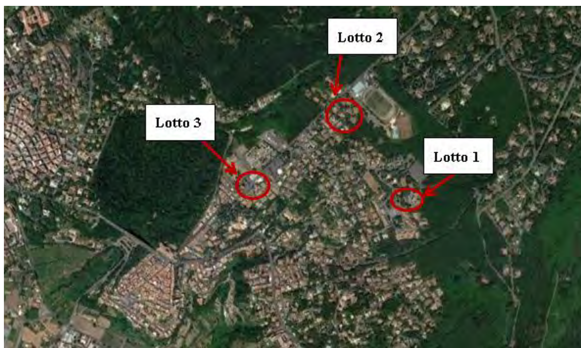
Figura 2. Individuazione dei lotti - Comune di Ariccia su foto aerea