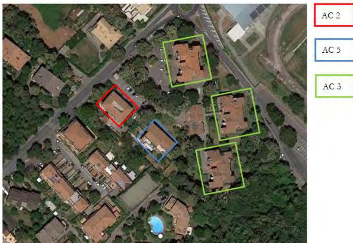
Figura 4. Individuazione delle Tipologie nel Lotto 2 – Comune di Ariccia