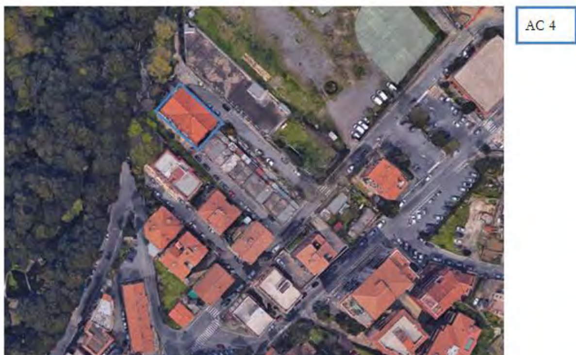
Figura 5. Individuazione delle Tipologie nel Lotto 3 – Comune di Ariccia