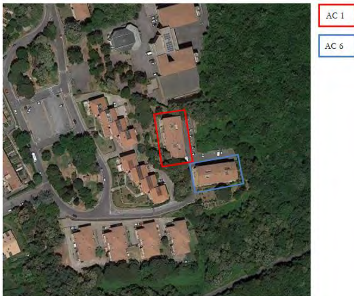
Figura 3. Individuazione delle Tipologie nel Lotto 1 – Comune di Ariccia