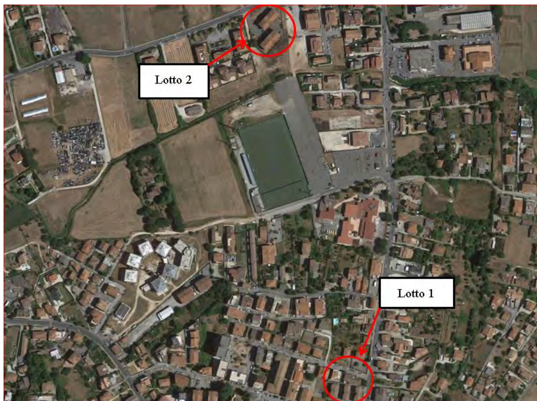
Figura 2. Individuazione dei lotti - Comune di Artena su foto aerea

Nei paragrafi successivi vengono fornite informazioni più dettagliate relativamente agli immobili e le relative tipologie.