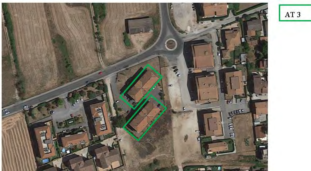
Figura 4. Individuazione delle Tipologie nel Lotto 2 – Comune di Artena