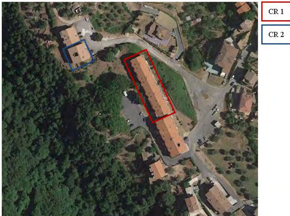
Figura 3. Individuazione delle Tipologie nel Lotto 1 – Comune di Carpineto Romano

Si riportano di seguito le immagini aeree con evidenziazione dell'ubicazione planimetrica delle tipologie individuate al paragrafo precedente: