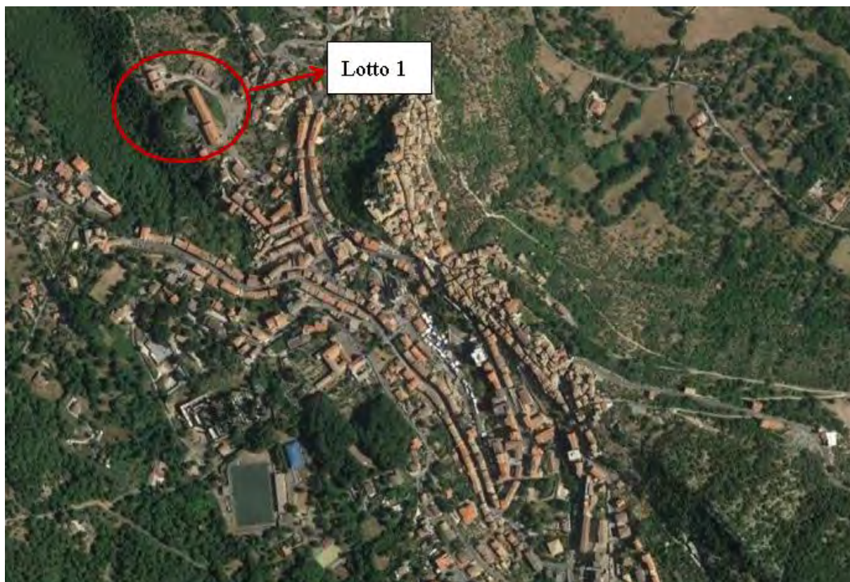
Figura 2. Individuazione dei lotti - Comune di Carpineto Romano su foto aerea

Nei paragrafi successivi vengono fornite informazioni più dettagliate relativamente agli immobili e le relative tipologie.