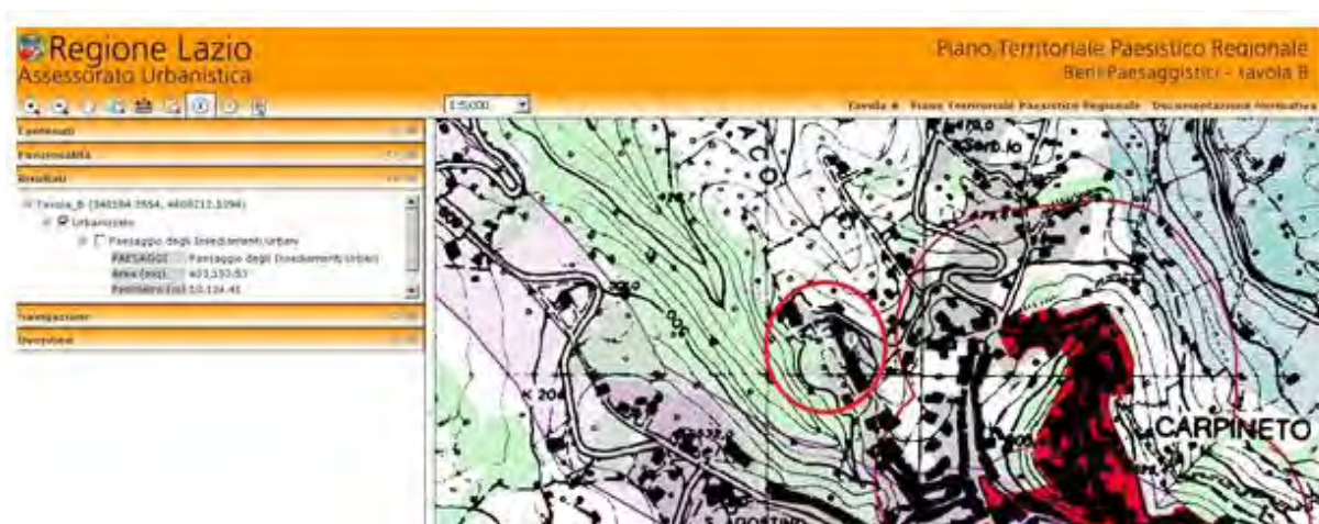
Figura 2. Via Prima Traversa Annunziata Nuova, 14-16-18-20-22-24-26-28 - Stralcio PTPR- tavola B

Nella Tav. B del P.T.P.R. – “Beni Paesaggistici” - l'area di intervento l'area di intervento non risulta vincolata.