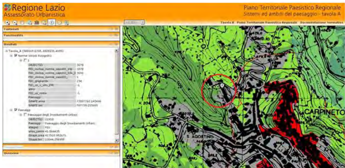
Figura 1. Via Prima Traversa Annunziata Nuova, 14-16-18-20-22-24-26-28 - Stralcio PTPR- tavola A

Di seguito viene riportato lo stralcio delle tavole A (Sistemi ed Ambiti del Paesaggio) e B (Beni Paesaggistici) del PTPR per le differenti aree.