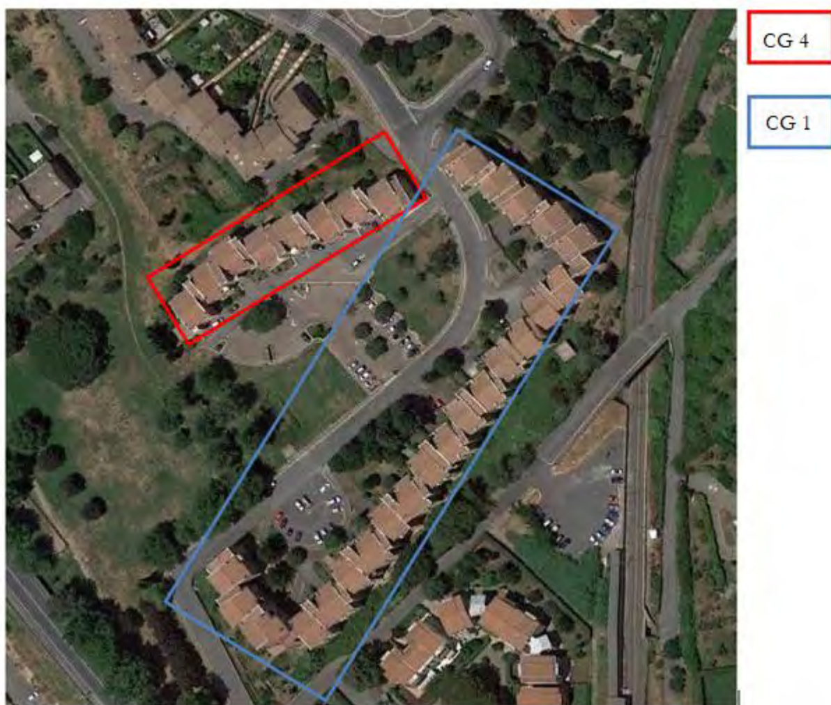
Figura 5. Individuazione delle Tipologie nel Lotto 3 – Comune di Castel Gandolfo