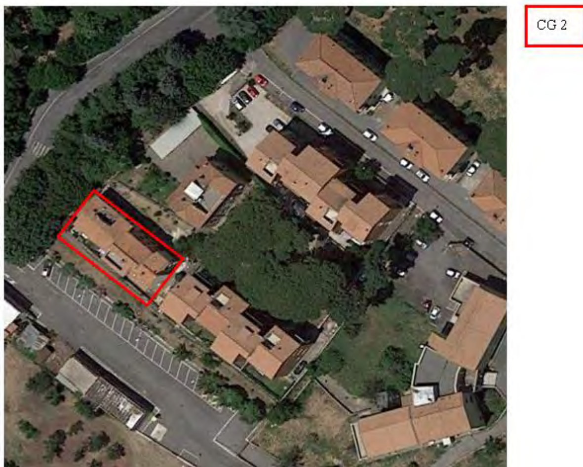
Figura 3. Individuazione delle Tipologie nel Lotto 1 – Comune di Castel Gandolfo