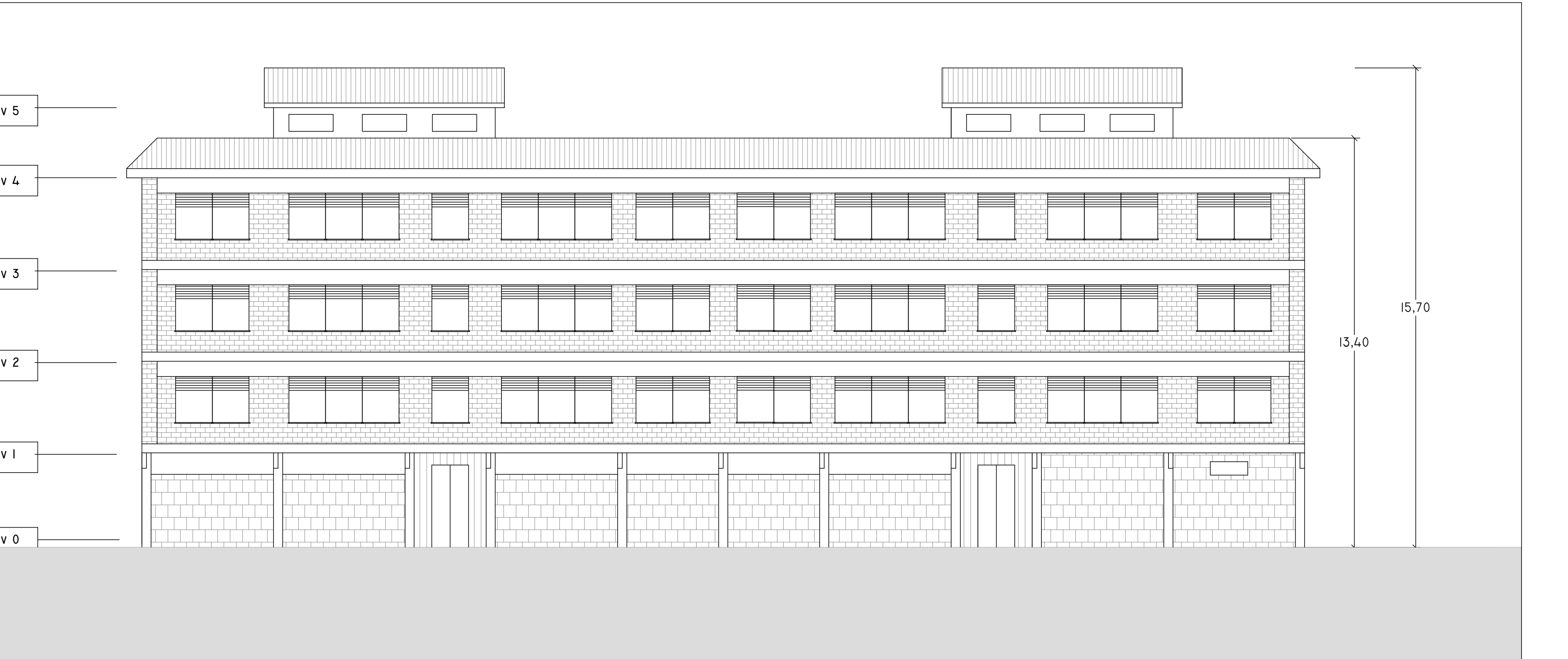
SUD 1 : 100

anno n. prog. anno cod. cliente categoria sottocategoria località fase n. rev. capitolo spoglio 20 005 411 ATER PRR CGA F 015 0 A D data rev. disegnata redatto operato approvato codice set-2020 0 architettura Pias Romano Saraceno -