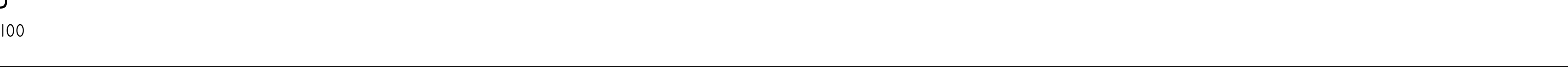
SEZIONE 1 : 100