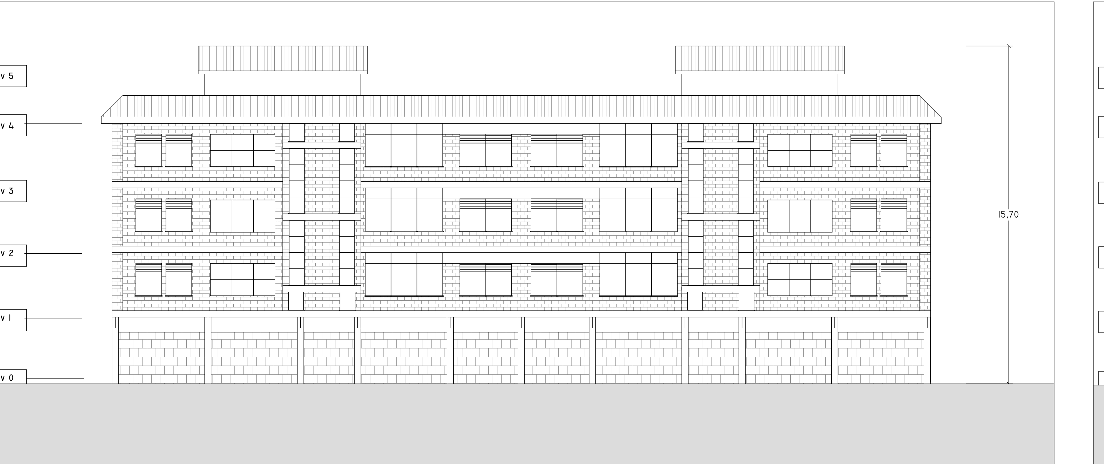
NORD 1 : 100