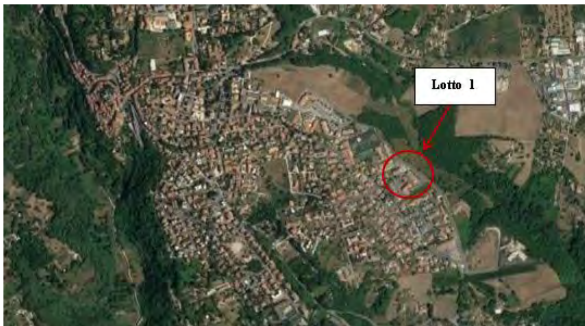
Figura 2. Individuazione dei lotti - Comune di Cave su foto aerea