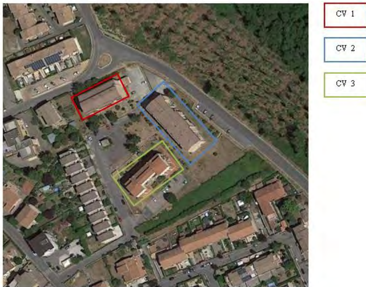
Figura 3. Individuazione delle Tipologie nel Lotto 1 – Comune di Cave