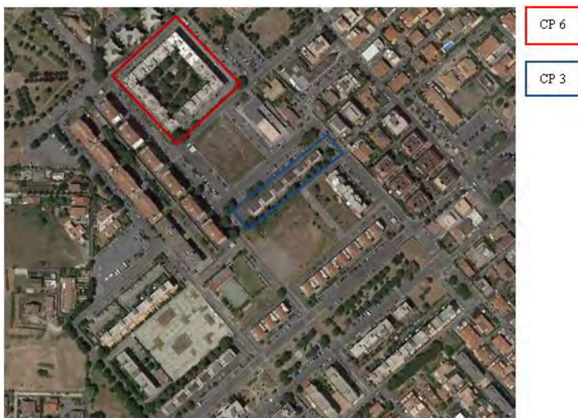
Figura 4. Individuazione delle Tipologie nel Lotto 2 – Comune di Ciampino