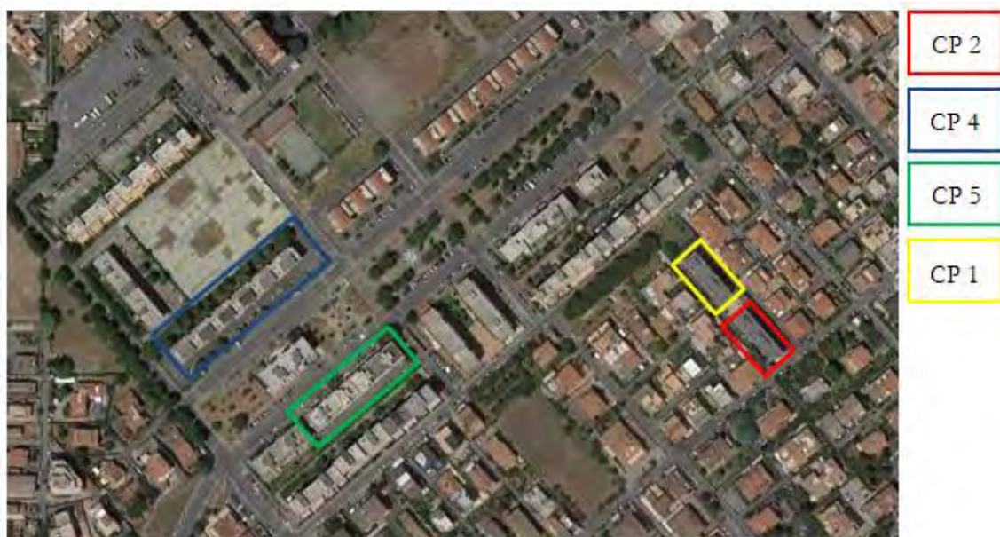
Figura 3. Individuazione delle Tipologie nel Lotto 1 – Comune di Ciampino