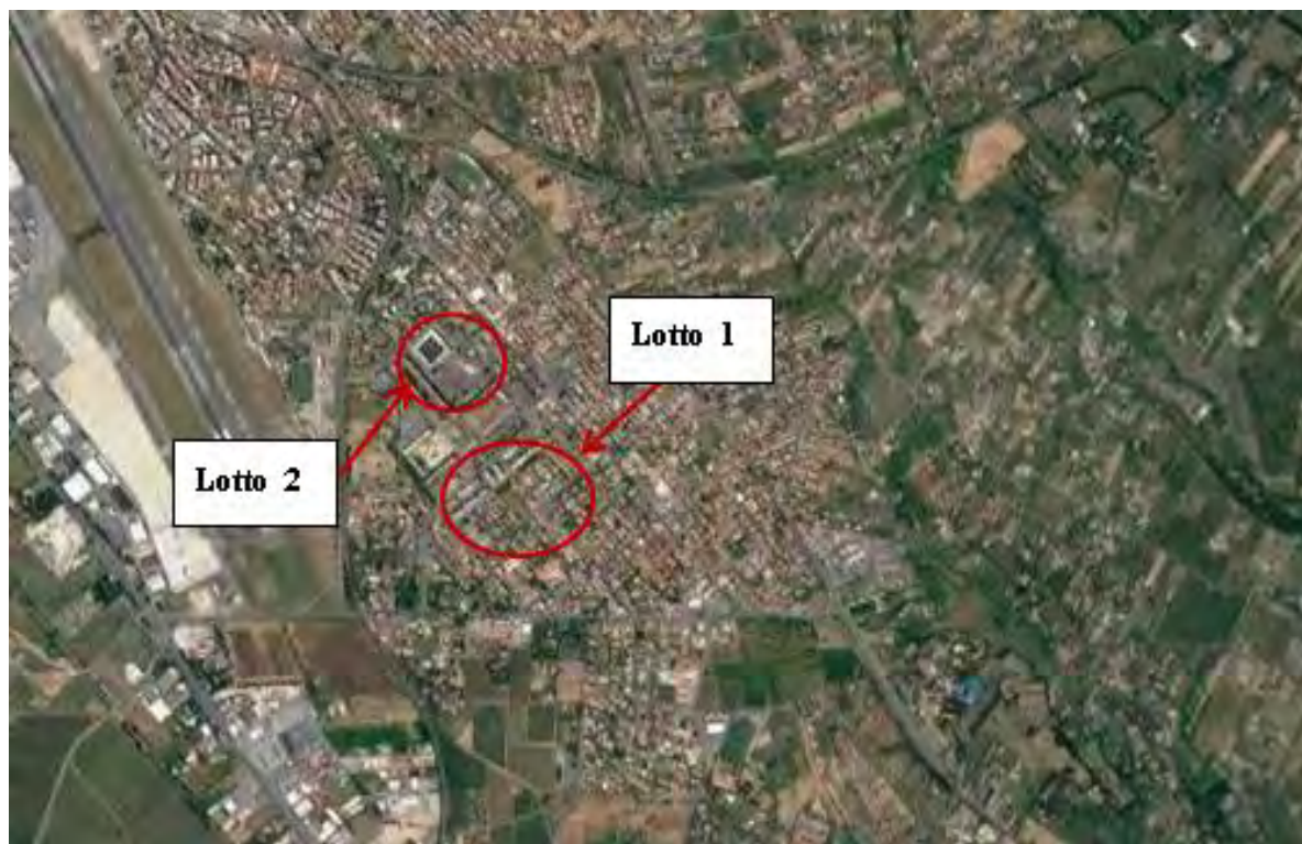
Figura 2. Individuazione dei lotti - Comune di Ciampino su foto aerea