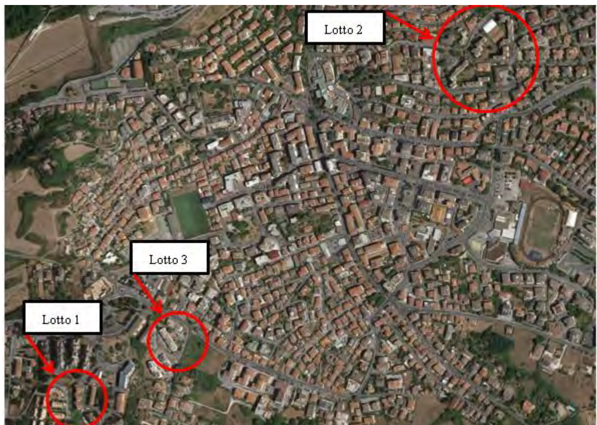
Figura 2. Individuazione dei lotti - Comune di Colleferro su foto aerea