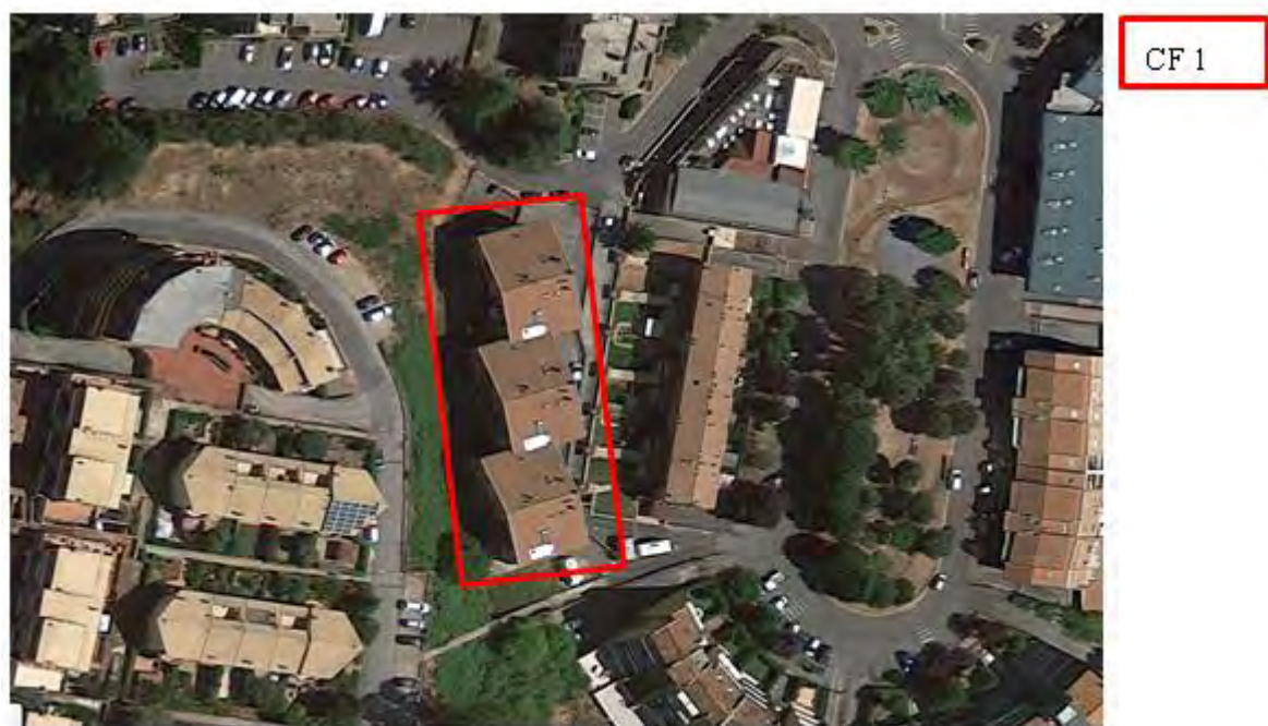
Figura 3. Individuazione delle Tipologie nel Lotto 1 – Comune di Colleferro