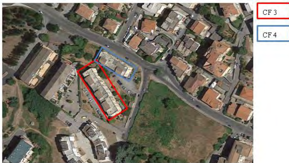
Figura 5. Individuazione delle Tipologie nel Lotto 3 – Comune di Colleferro