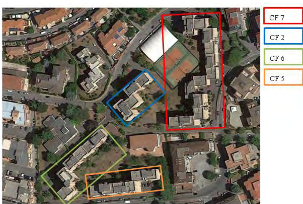
Figura 4. Individuazione delle Tipologie nel Lotto 2 – Comune di Colleferro