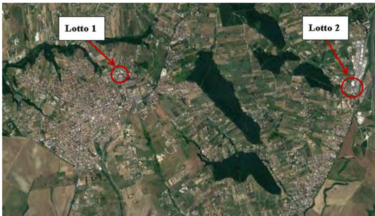
Figura 2. Individuazione dei lotti - Comune di Fonte Nuova su foto aerea