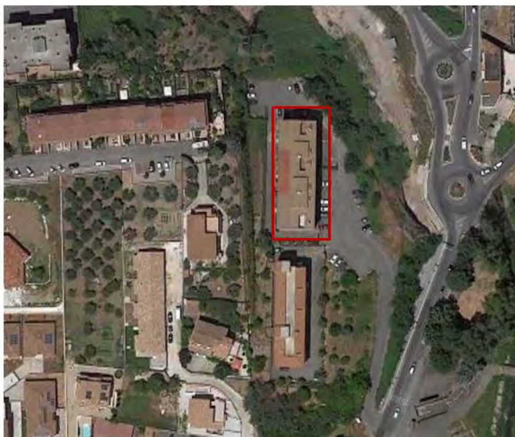
Figura 3. Individuazione delle Tipologie nel Lotto 1 – Comune di Fonte Nuova