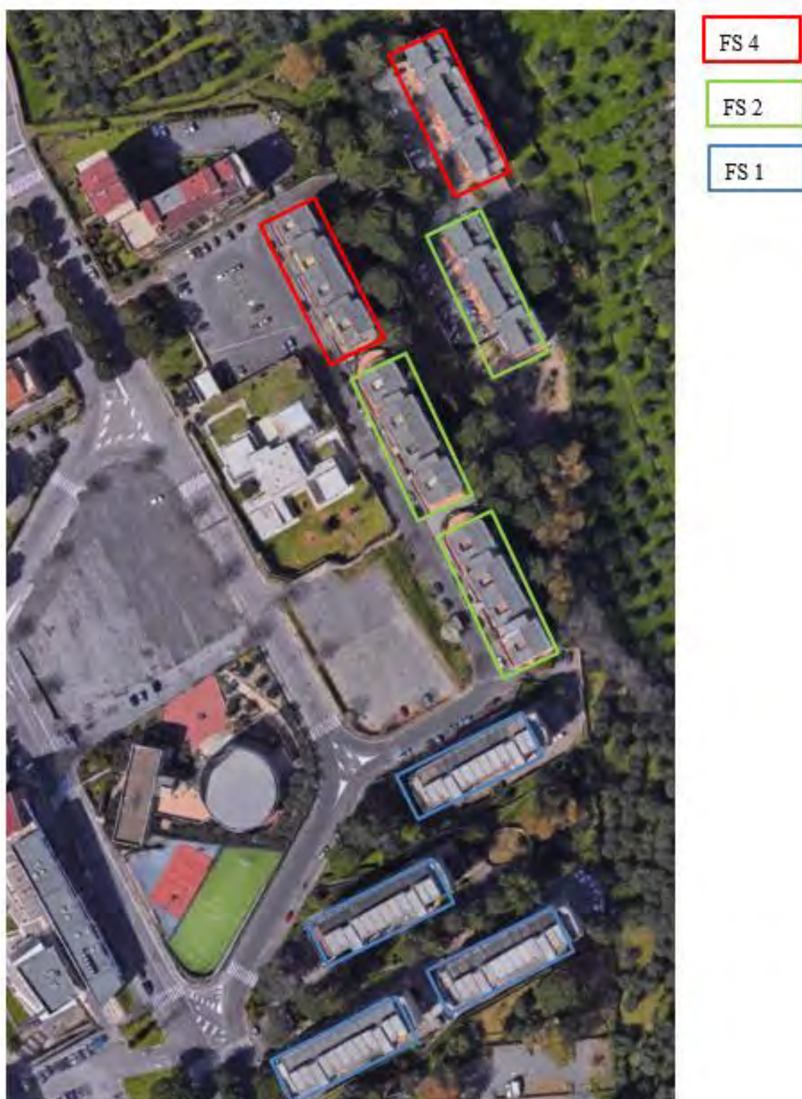
Figura 6. Individuazione delle Tipologie nel Lotto 2 – Comune di Frascati