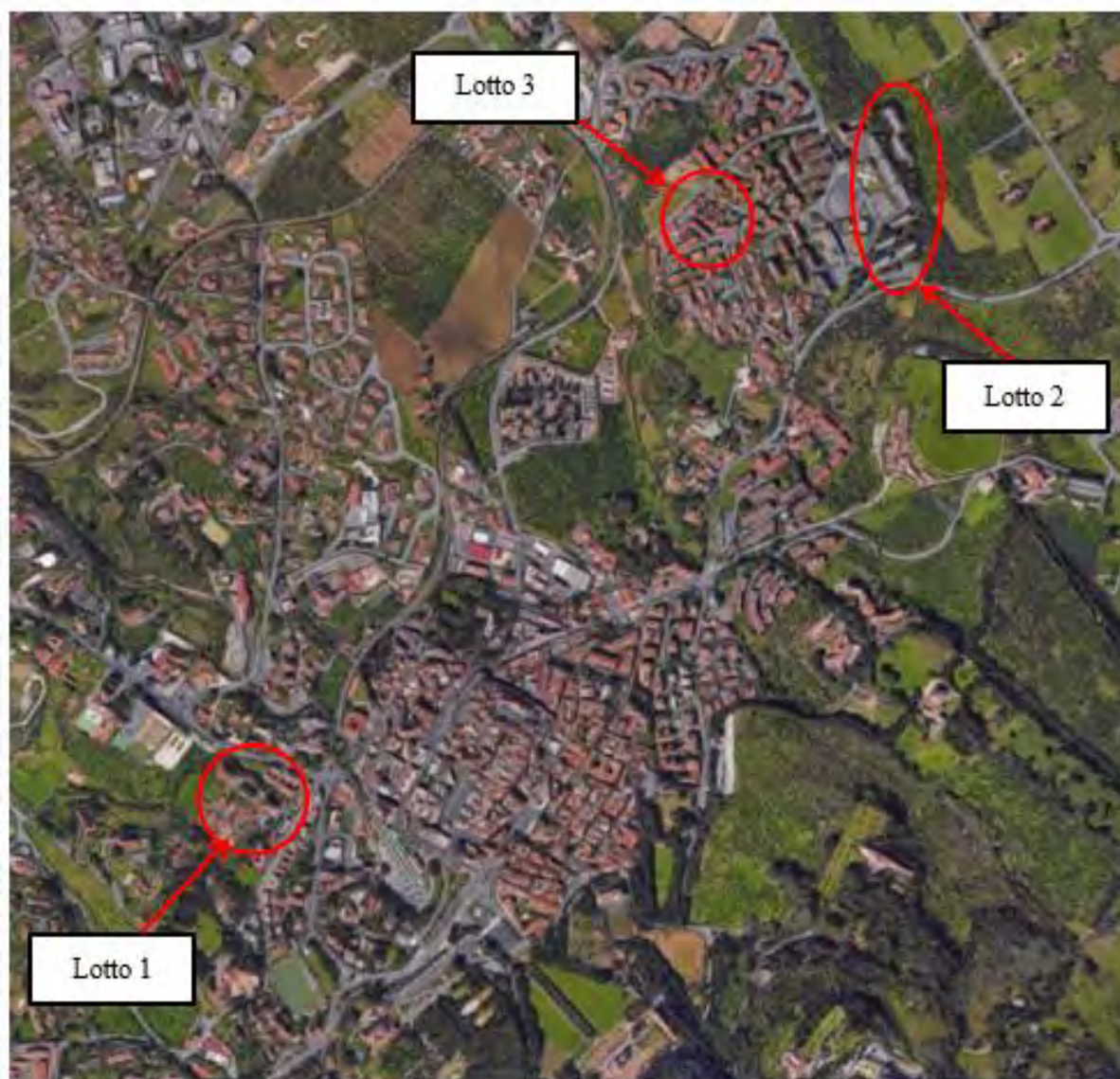
Figura 3. Individuazione dei lotti - Comune di Frascati su foto aerea

Nei paragrafi successivi vengono fornite informazioni più dettagliate relativamente agli immobili e le relative tipologie.