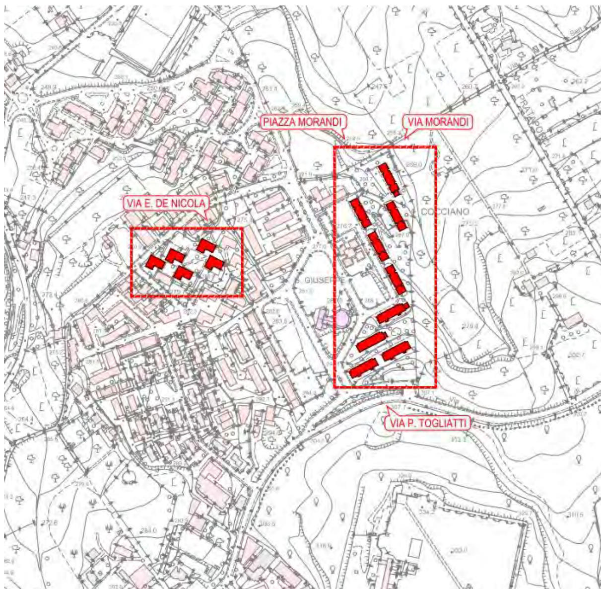
Figura 2. Immobili oggetto di intervento su C.T.R.