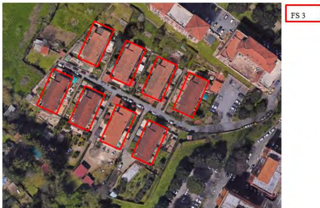
Figura 4. Individuazione delle Tipologie nel Lotto 1 – Comune di Frascati