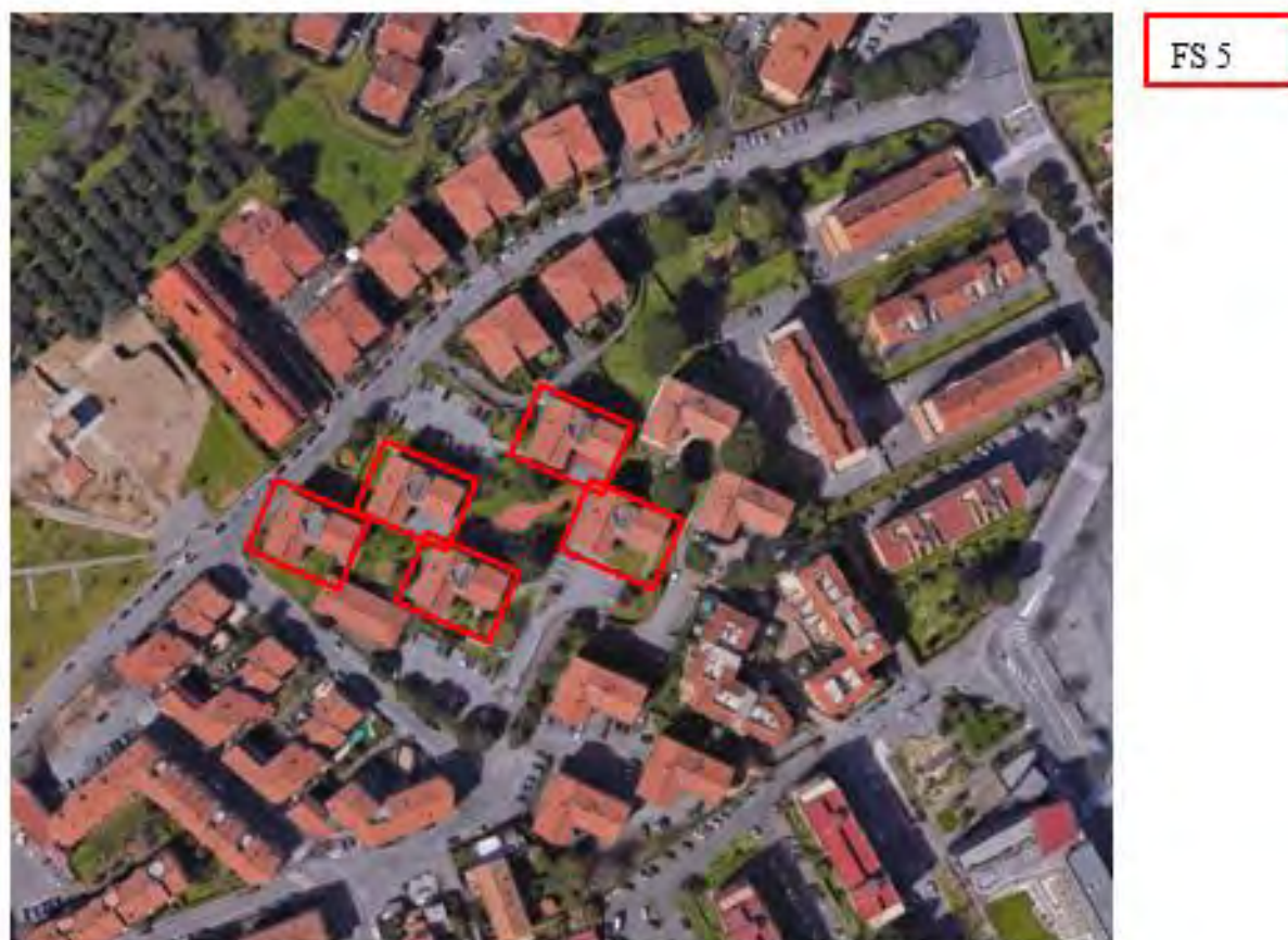
Figura 5. Individuazione delle Tipologie nel Lotto 3 – Comune di Frascati