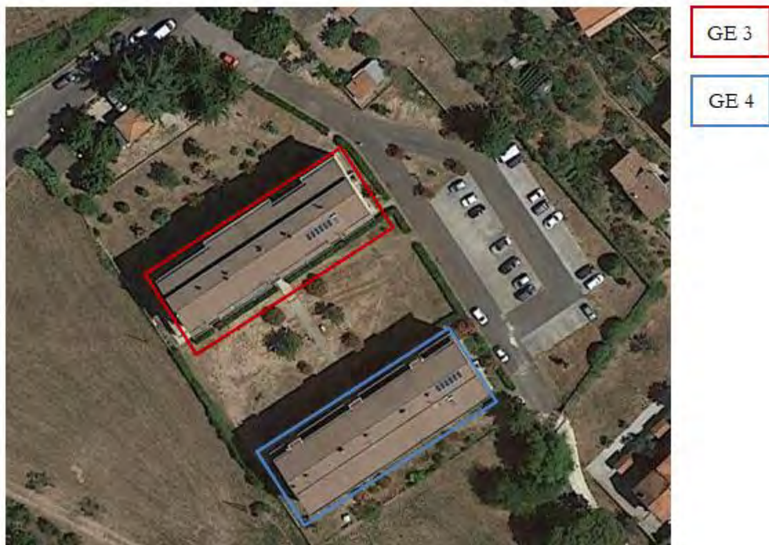
Figura 4. Individuazione delle Tipologie nel Lotto 2 – Comune di Genazzano