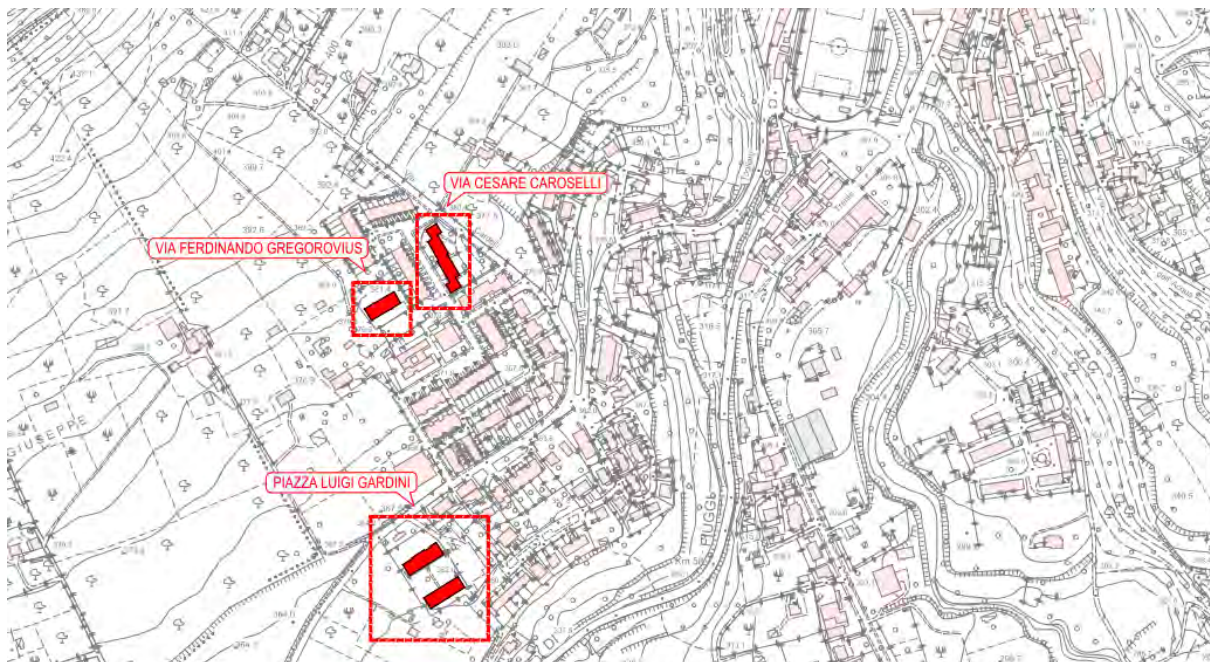
Figura 1. Immobili oggetto di intervento su C.T.R.

Gli immobili gestiti dall'ATER nel Comune di Genazzano ed oggetto di intervento sono individuati nella planimetria di seguito riportata