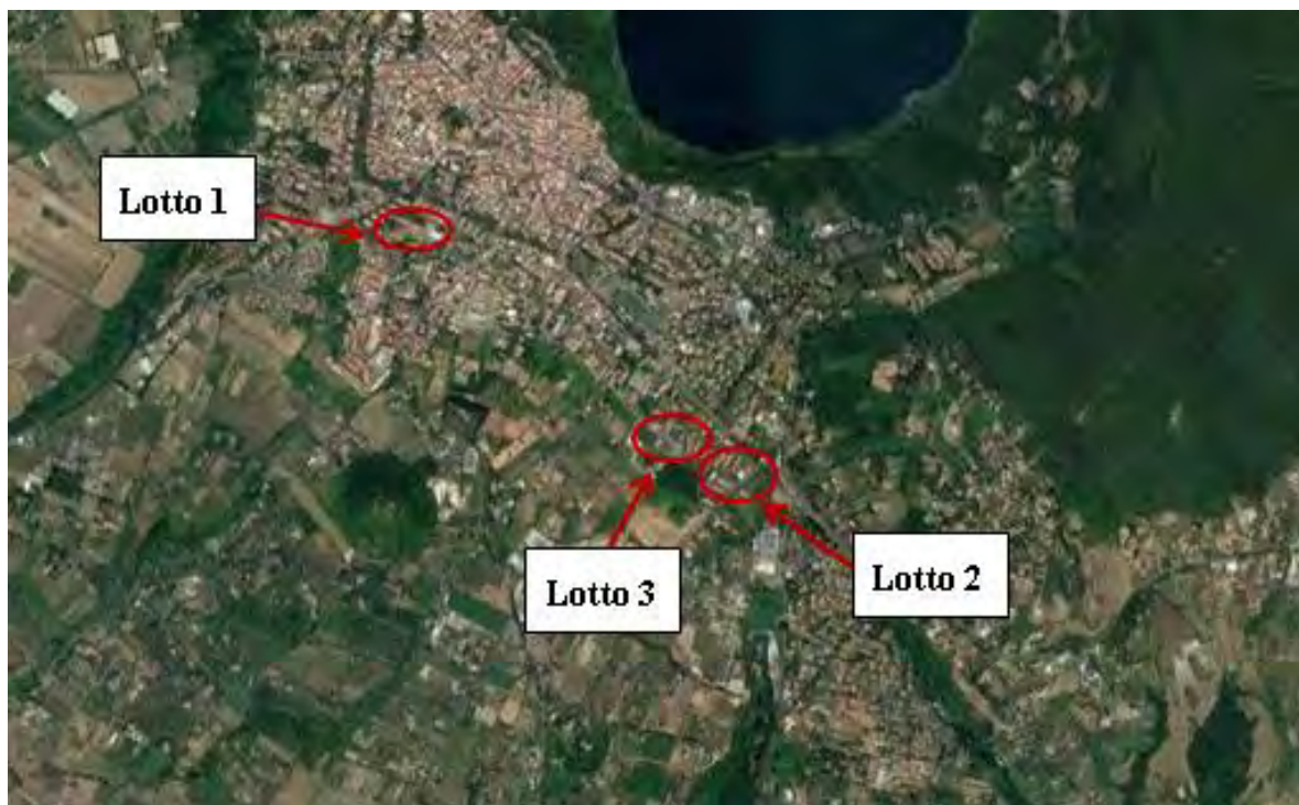
Figura 2. Individuazione dei lotti - Comune di Genzano di Roma su foto aerea