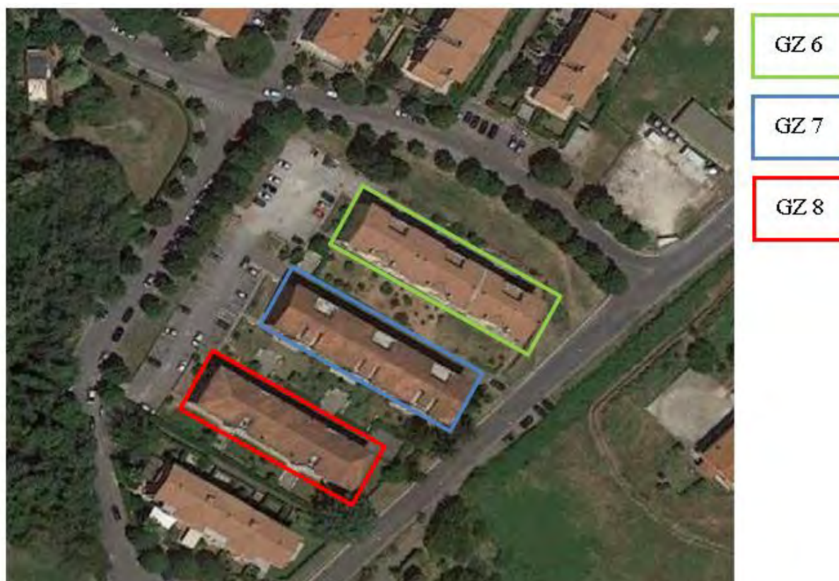
Figura 4. Individuazione delle Tipologie nel Lotto 2 – Comune di Genzano di Roma