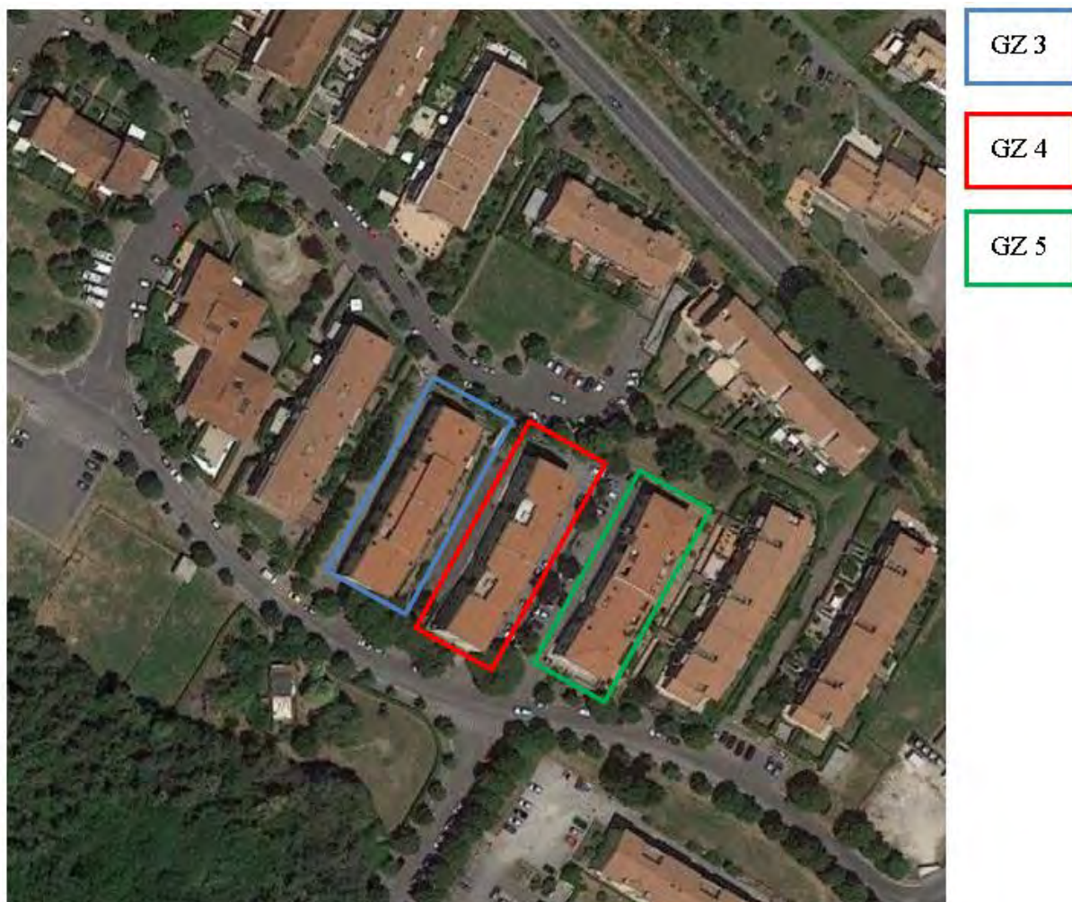
Figura 5. Individuazione delle Tipologie nel Lotto 3 – Comune di Genzano di Roma