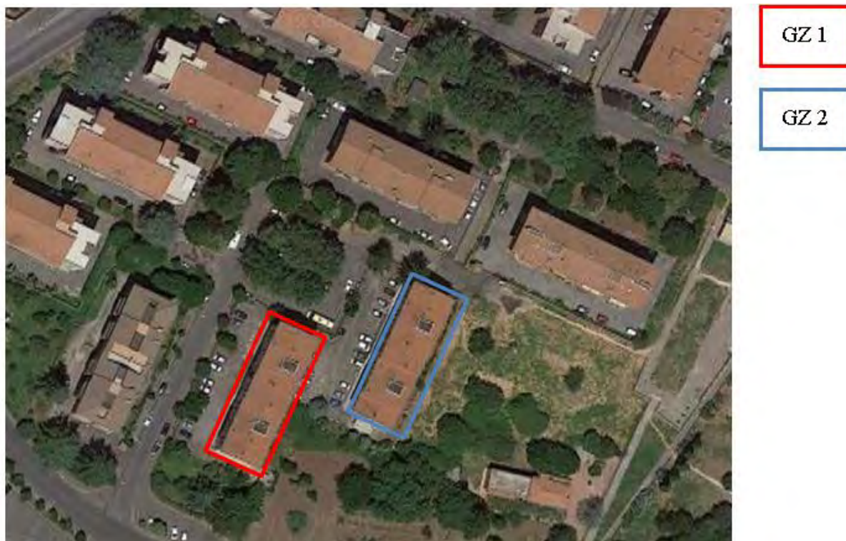
Figura 3. Individuazione delle Tipologie nel Lotto 1 – Comune di Genzano di Roma