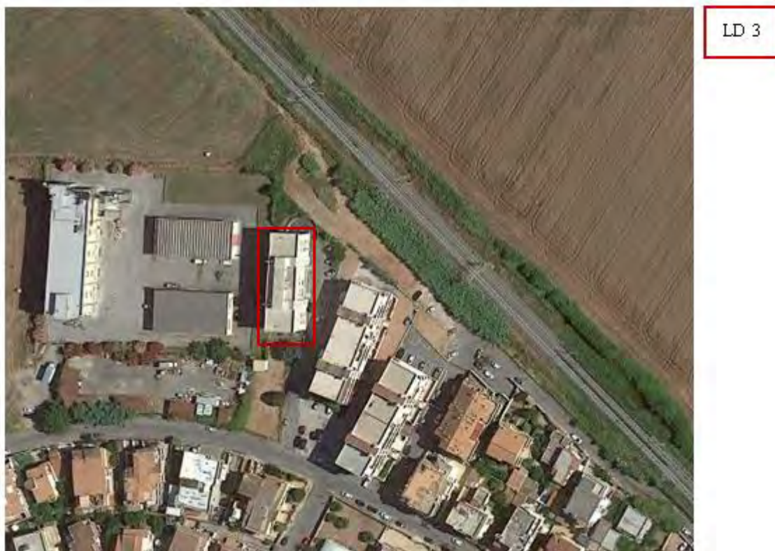
Figura 5. Individuazione delle Tipologie nel Lotto 3 – Comune di Ladispoli