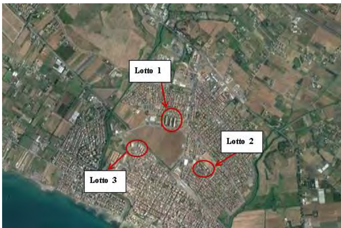
Figura 2. Individuazione dei lotti - Comune di Ladispoli su foto aerea