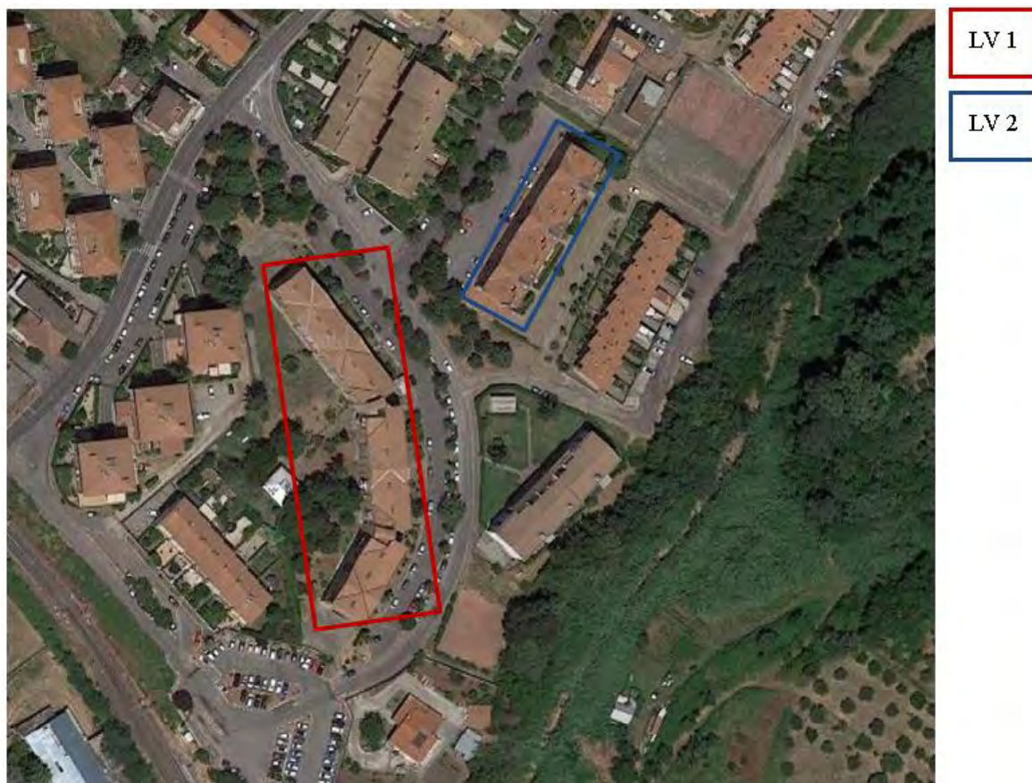
Figura 3. Individuazione delle Tipologie nel Lotto 1 – Comune di Lanuvio

Si riportano di seguito le immagini aeree con evidenziazione dell'ubicazione planimetrica delle tipologie individuate al paragrafo precedente: