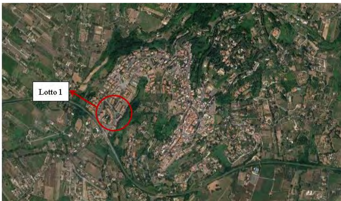
Figura 2. Individuazione dei lotti - Comune di Lanuvio su foto aerea

Nei paragrafi successivi vengono fornite informazioni più dettagliate relativamente agli immobili e le relative tipologie.