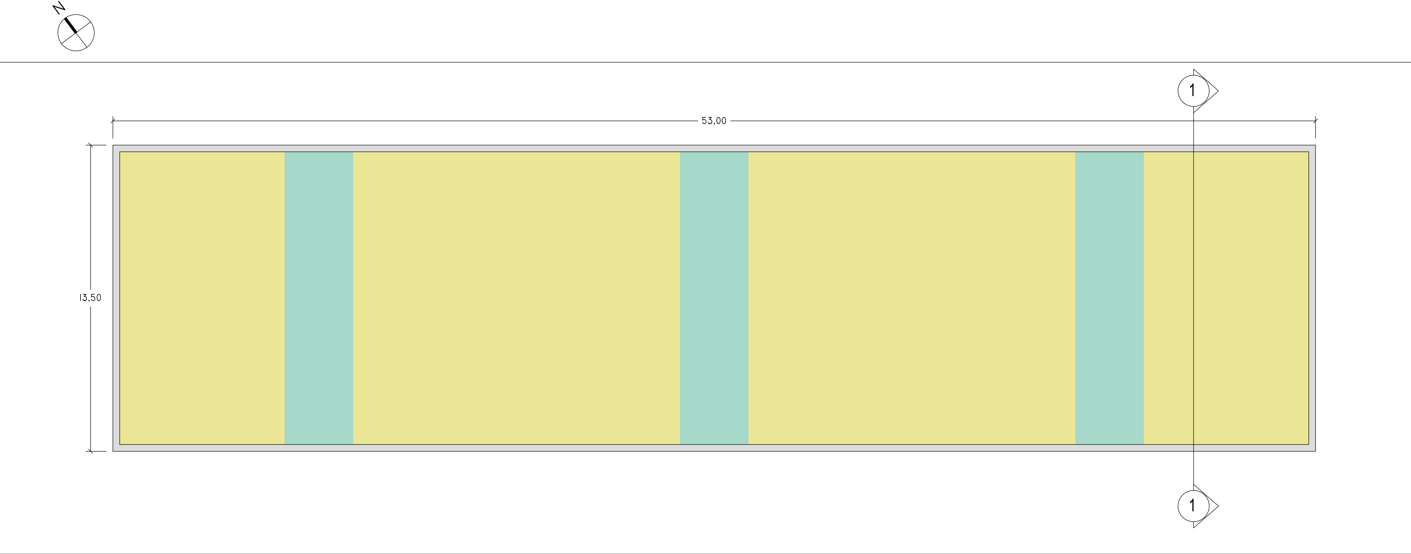
LIV 0 I : 100