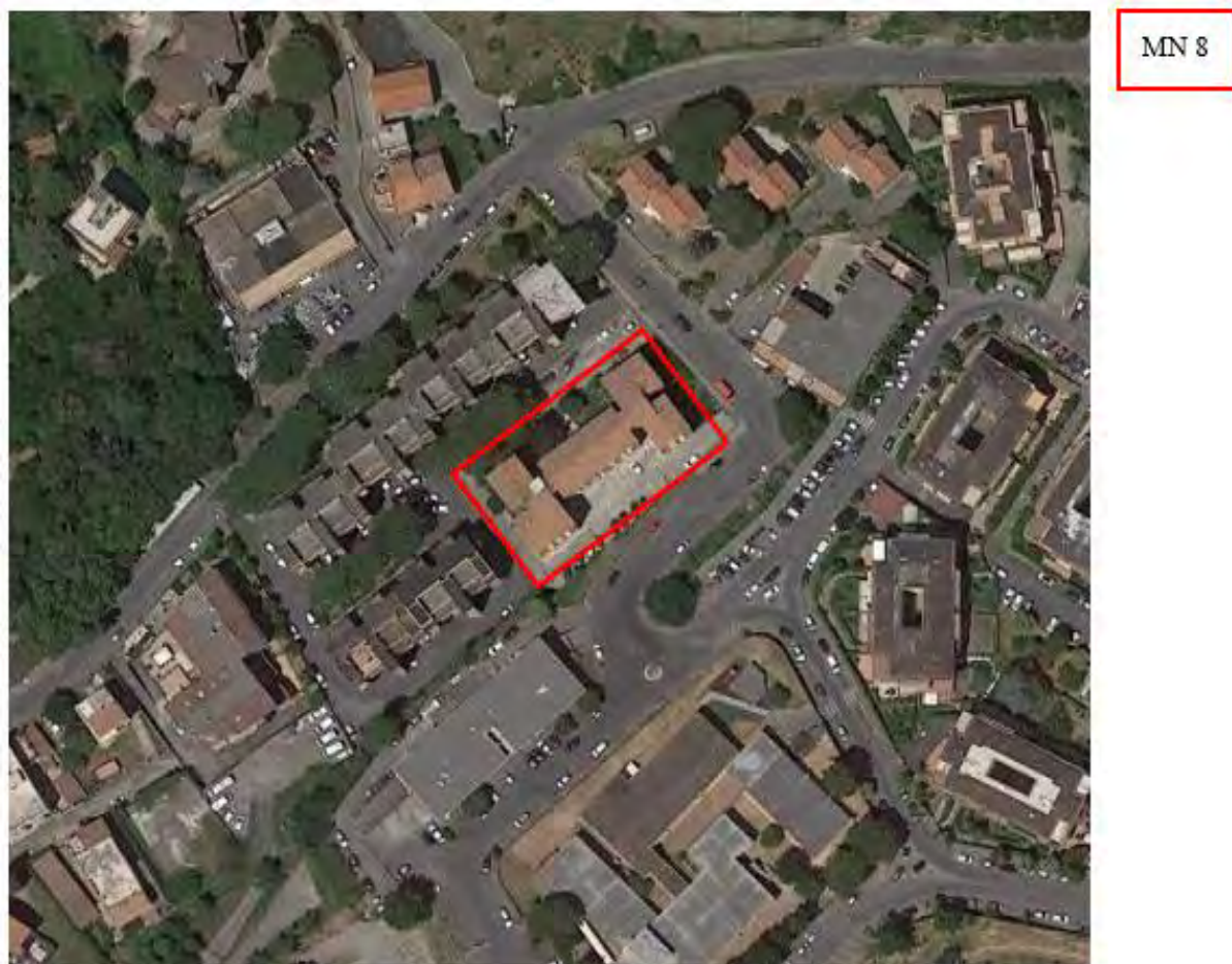
Figura 3. Individuazione delle Tipologie nel Lotto 1 – Comune di Marino