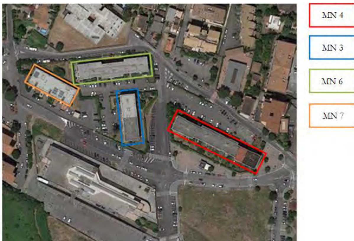
Figura 6. Individuazione delle Tipologie nel Lotto 4 – Comune di Marino