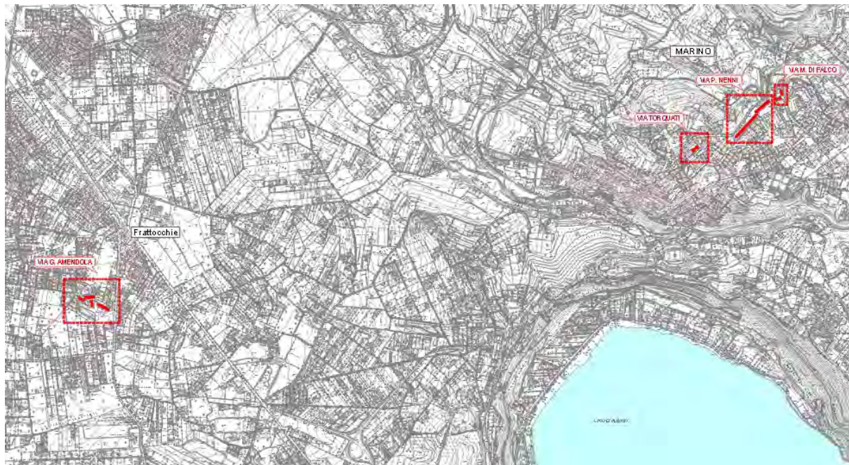
Figura 1. Immobili oggetto di intervento su C.T.R.

Gli immobili gestiti dall'ATER nel Comune di Marino ed oggetto di intervento sono individuati nella planimetria di seguito riportata