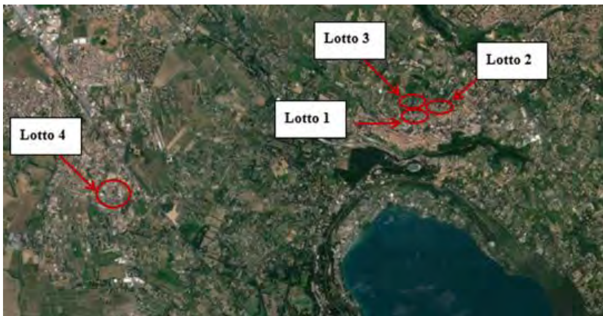
Figura 2. Individuazione dei lotti - Comune di Marino su foto aerea

Nei paragrafi successivi vengono fornite informazioni più dettagliate relativamente agli immobili e le relative tipologie.