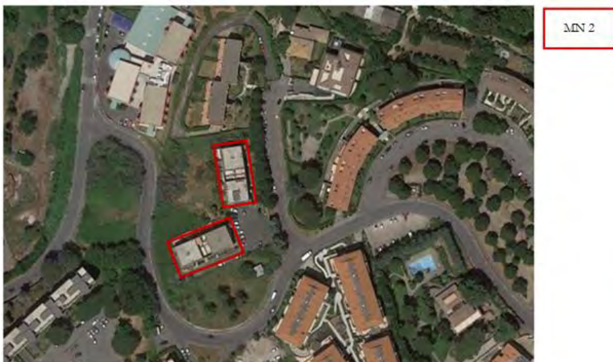
Figura 5. Individuazione delle Tipologie nel Lotto 3 – Comune di Marino