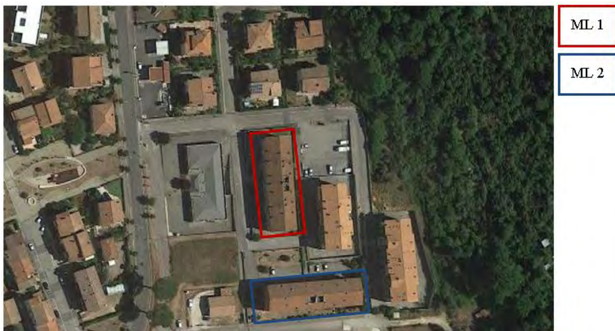
Figura 3. Individuazione delle Tipologie nel Lotto 1 – Comune di Montelanico

Si riportano di seguito le immagini aeree con evidenziazione dell'ubicazione planimetrica delle tipologie individuate al paragrafo precedente: