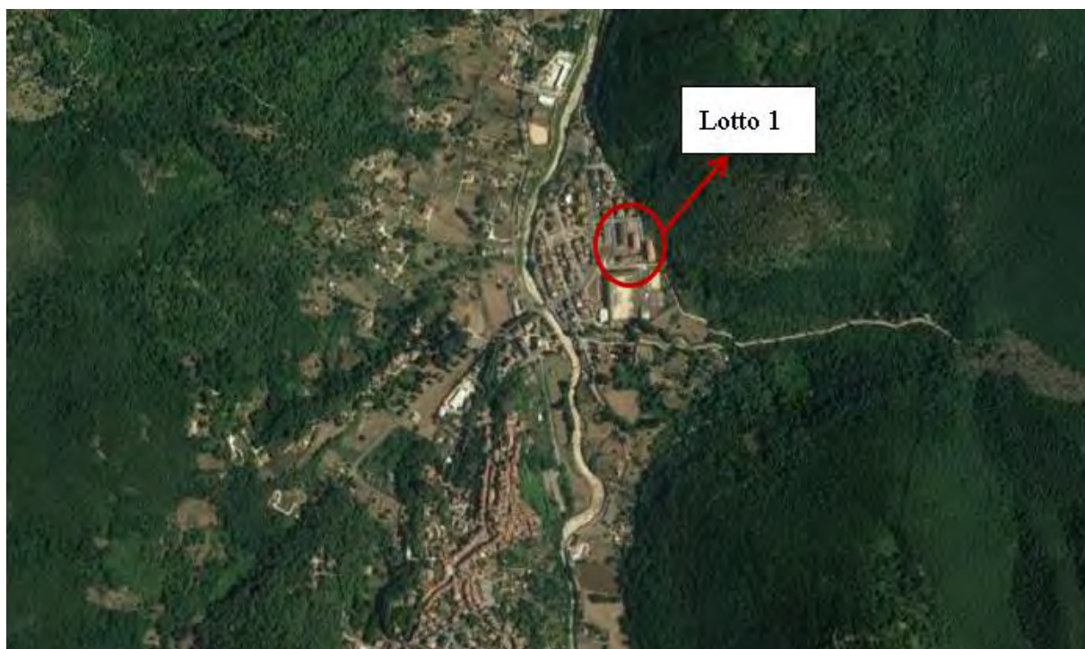
Figura 2. Individuazione dei lotti - Comune di Montelanico su foto aerea