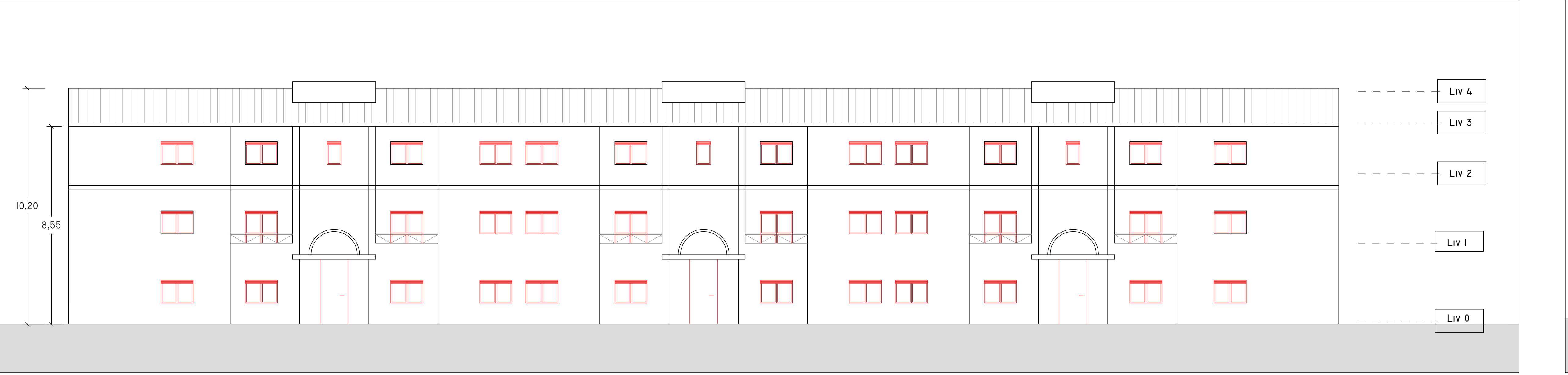
NORD I : 100

data set-2020 n. disegno 0 disegnata architettura relato Plus confermato Romano approvato Saraceno codice -