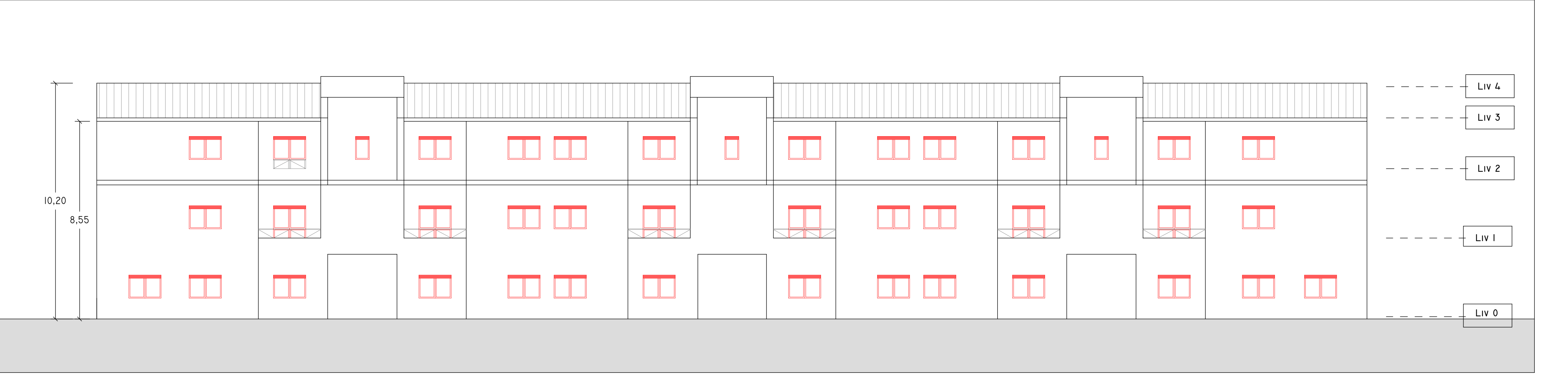
SUD I : 100