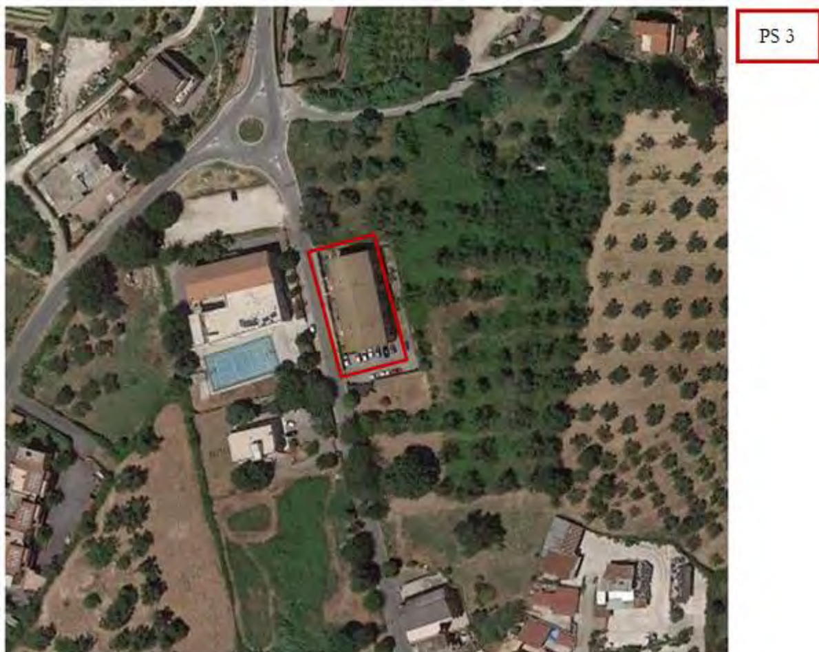
Figura 4. Individuazione delle Tipologie nel Lotto 2 – Comune di Palombara Sabina