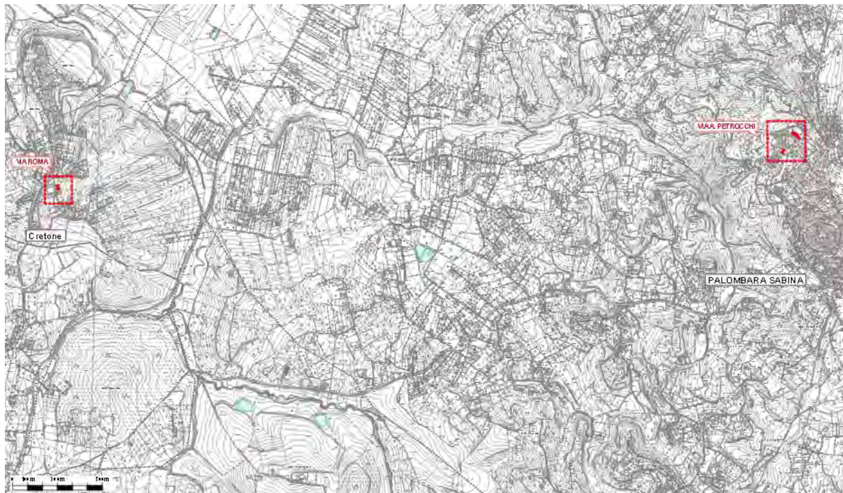
Figura 1. Immobili oggetto di intervento su C.T.R.

Gli immobili gestiti dall'ATER nel Comune di Palombara Sabina ed oggetto di intervento sono individuati nella planimetria di seguito riportata