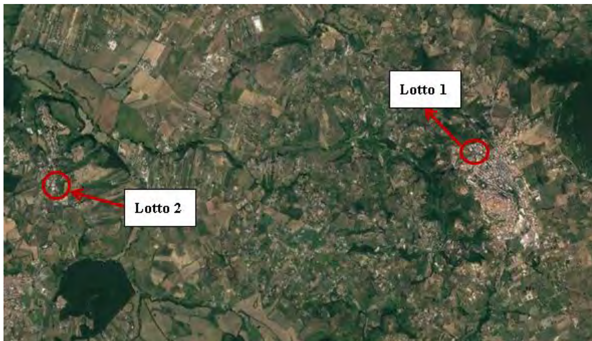
Figura 2. Individuazione dei lotti - Comune di Palombara Sabina su foto aerea