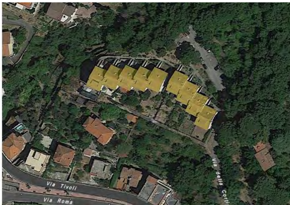
Figura 3. Individuazione della Tipologia PO 1– Comune di Poli

Si riportano di seguito le immagini aeree con evidenziazione dell'ubicazione planimetrica della tipologia individuata al paragrafo precedente: