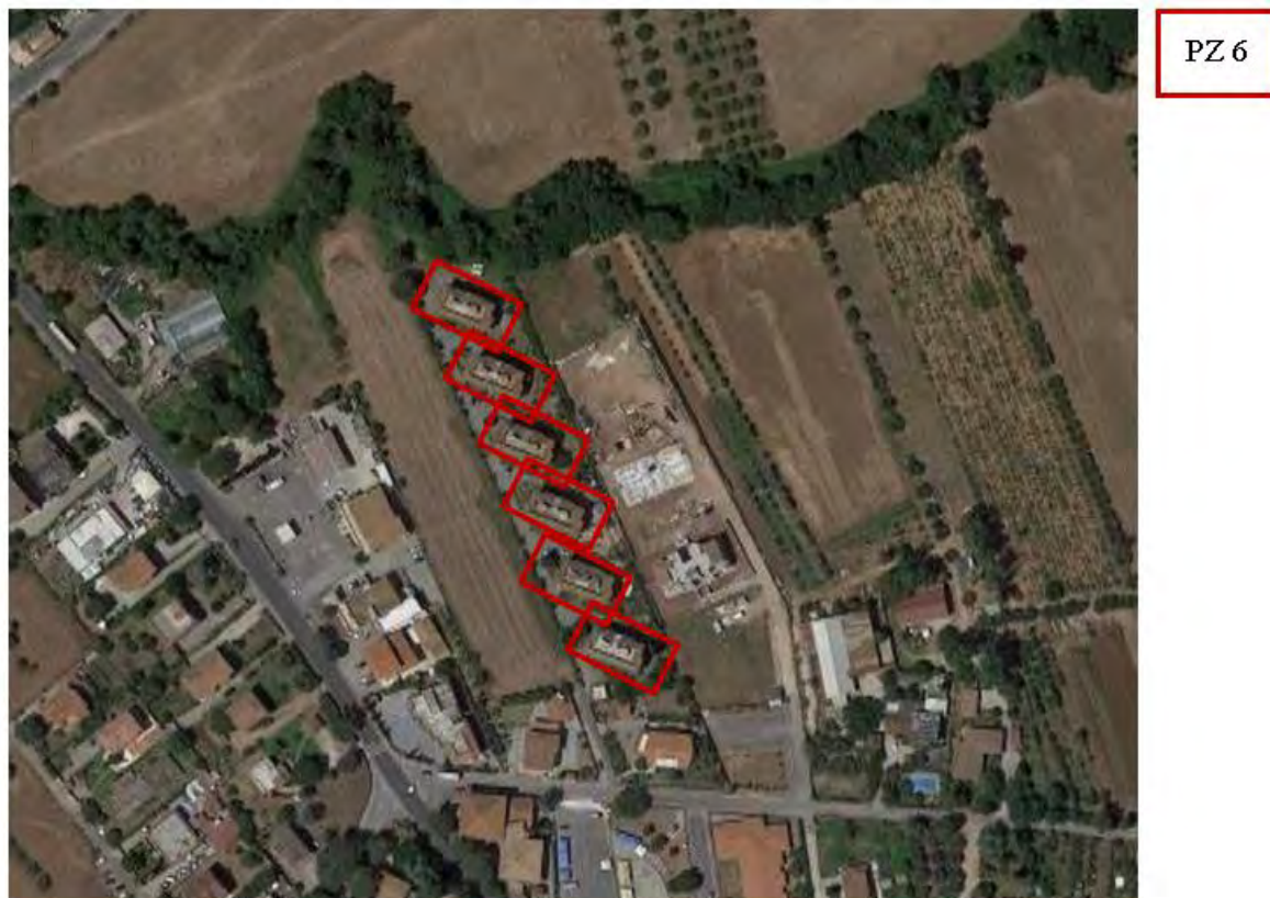
Figura 6. Individuazione delle Tipologie nel Lotto 4 – Comune di Pomezia