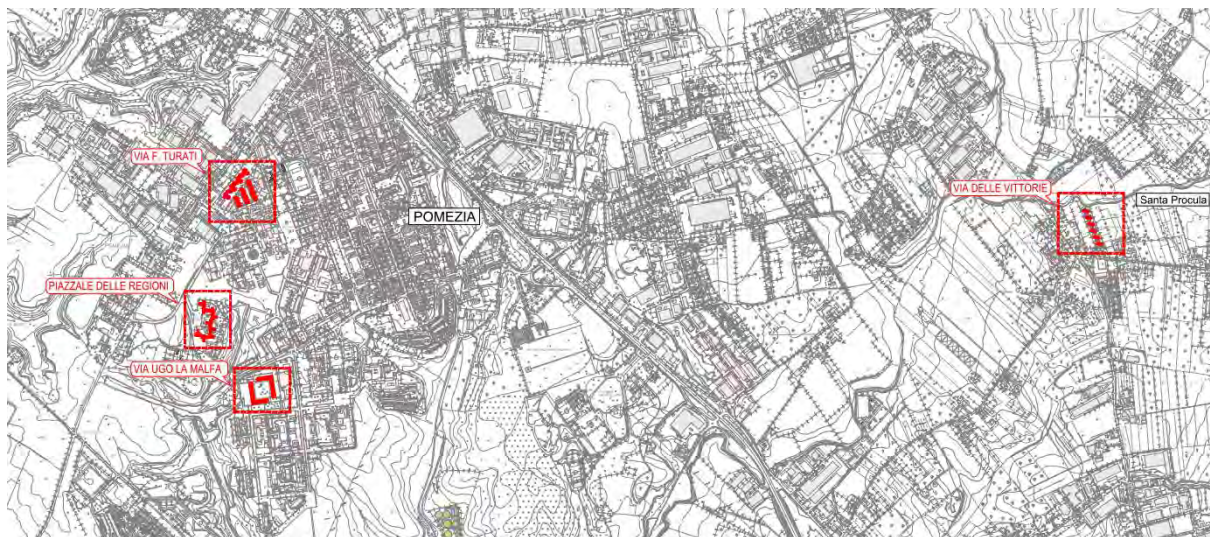
Figura 1. Immobili oggetto di intervento su C.T.R.

Gli immobili gestiti dall'ATER nel Comune di Pomezia ed oggetto di intervento sono individuati nella planimetria di seguito riportata