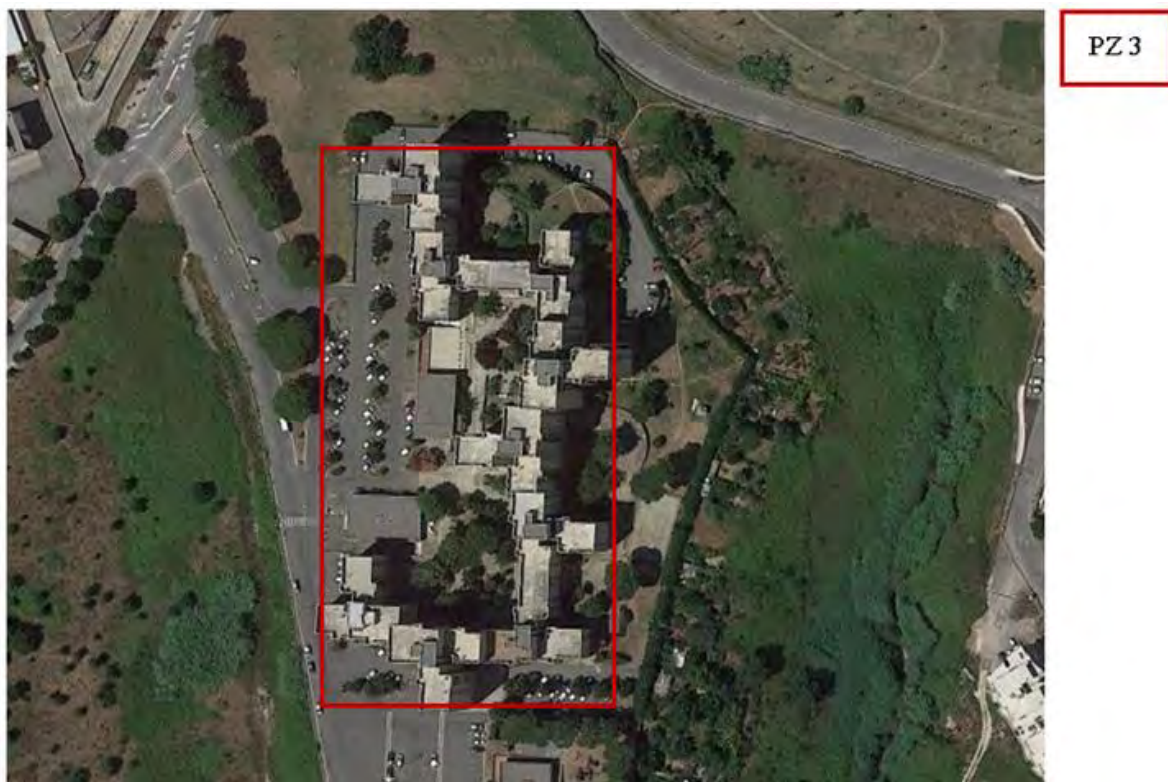
Figura 3. Individuazione delle Tipologie nel Lotto 1 – Comune di Pomezia