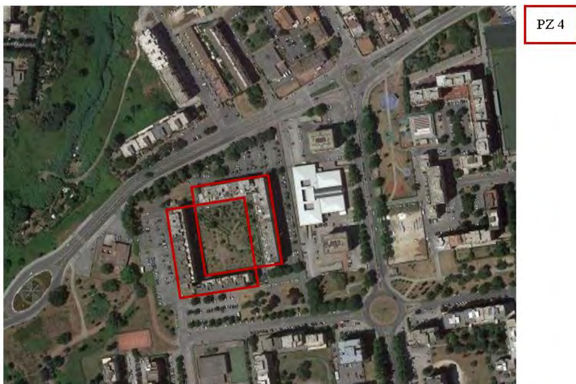
Figura 4. Individuazione delle Tipologie nel Lotto 2 – Comune di Pomezia