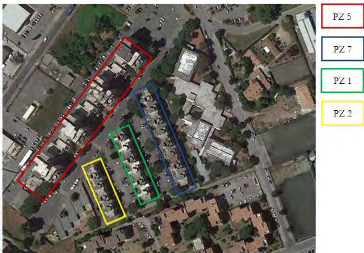
Figura 5. Individuazione delle Tipologie nel Lotto 3 – Comune di Pomezia