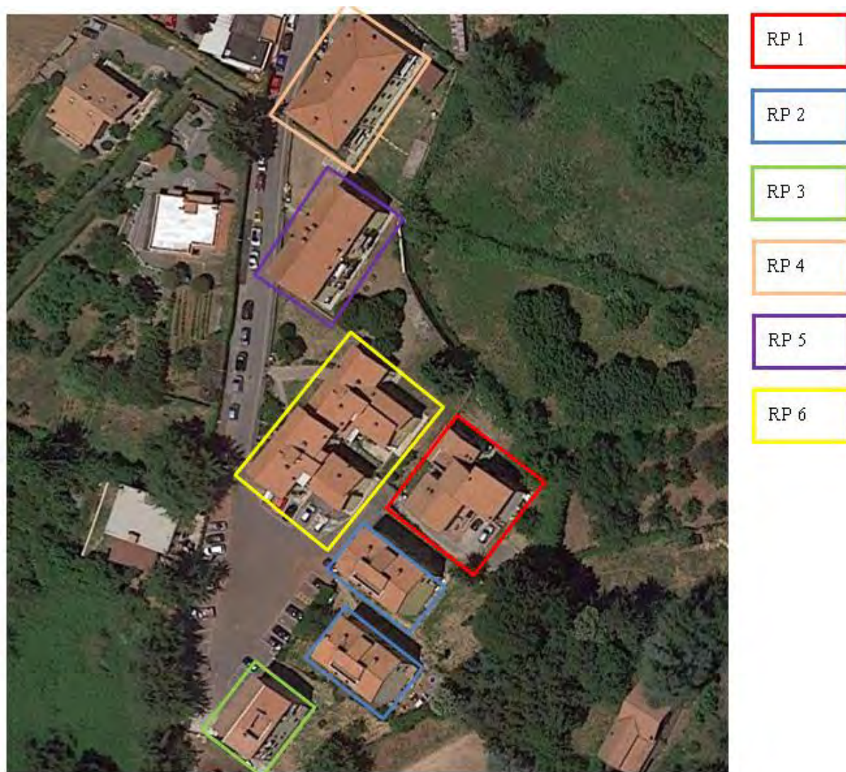
Figura 3. Individuazione delle Tipologie nel Lotto 1 – Comune di Rocca Priora