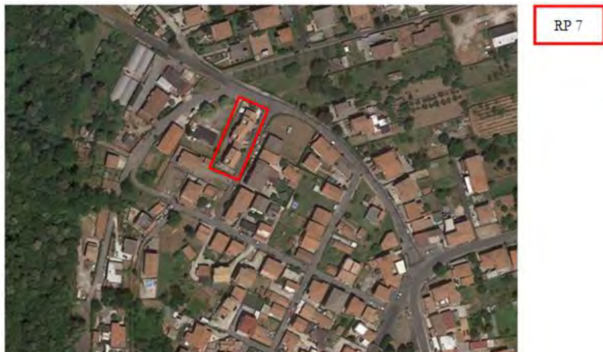
Figura 4. Individuazione delle Tipologie nel Lotto 2 – Comune di Rocca Priora