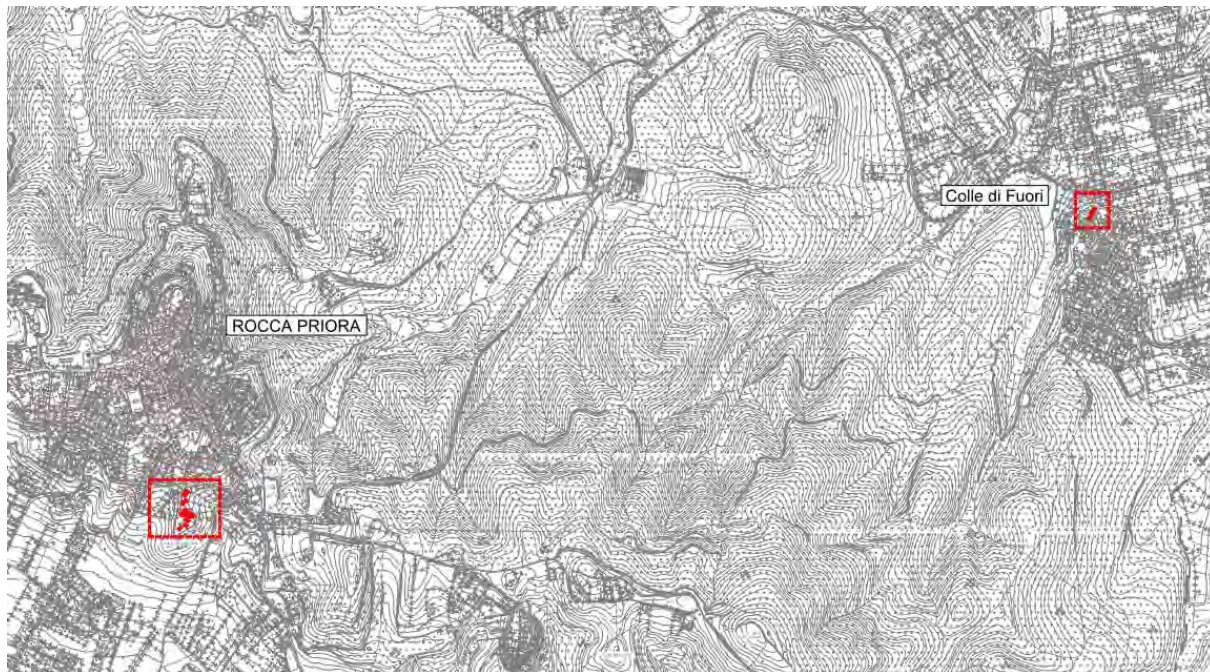
Figura 1. Immobili oggetto di intervento su C.T.R.

Gli immobili gestiti dall'ATER nel Comune di Rocca Priora ed oggetto di intervento sono individuati nella planimetria di seguito riportata