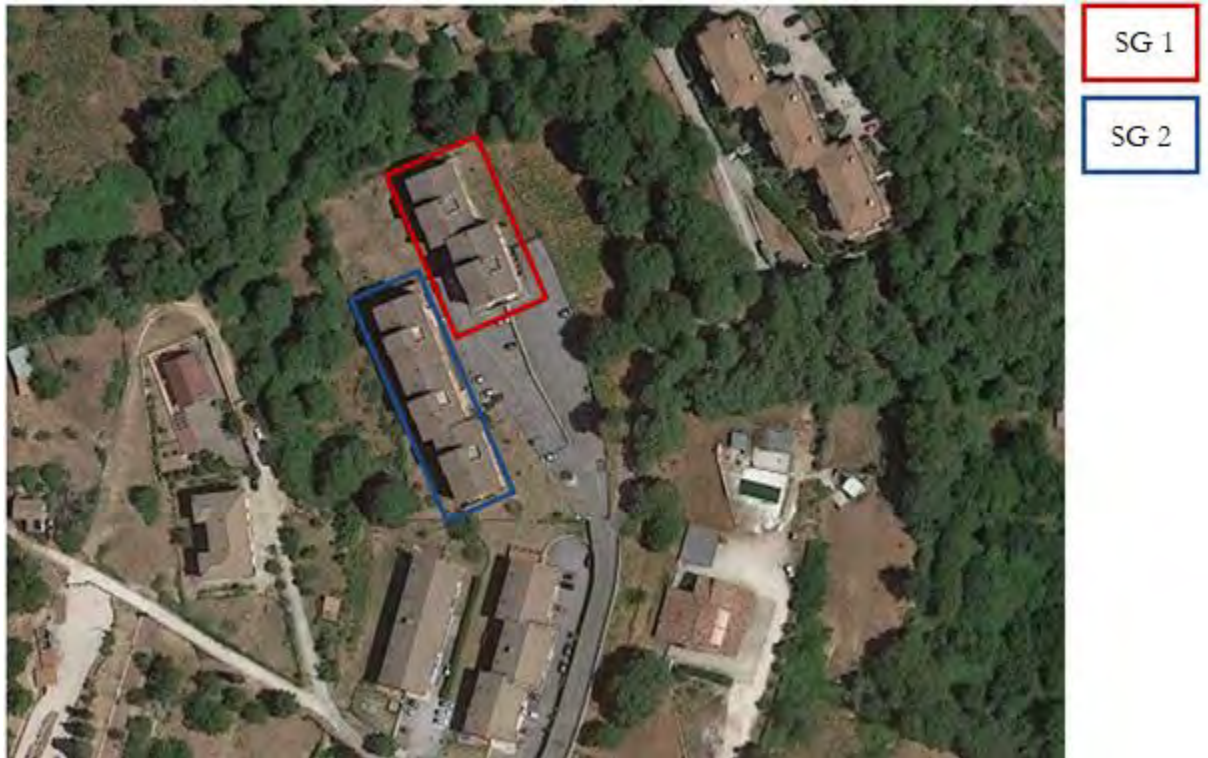
Figura 3. Individuazione delle Tipologie nel Lotto 1 – Comune di Segni