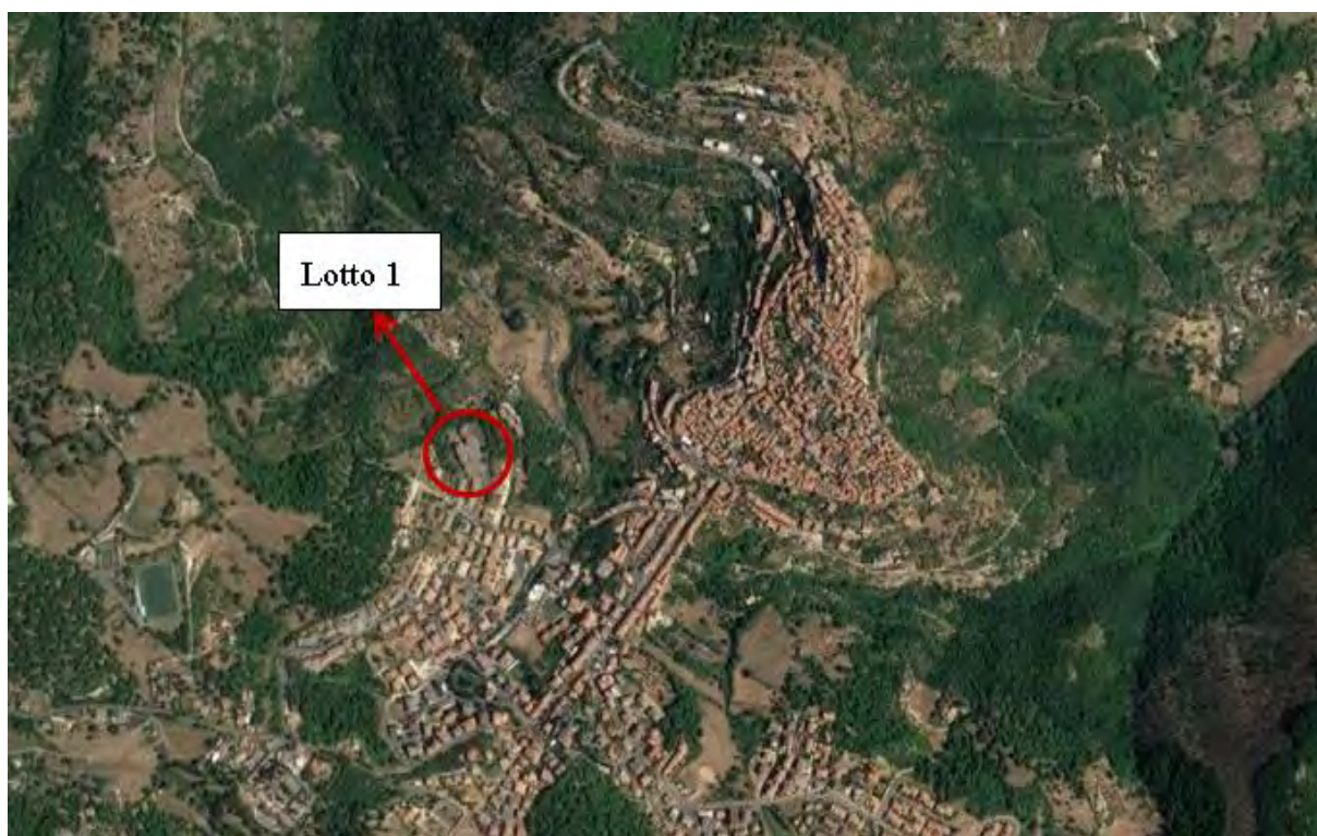
Figura 2. Individuazione dei lotti - Comune di Segni su foto aerea