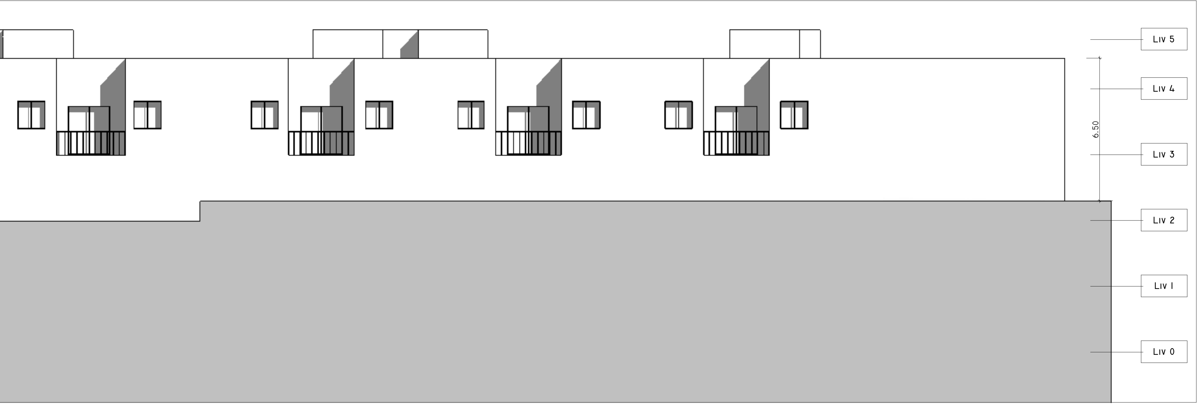
SUD EST 1 : 100