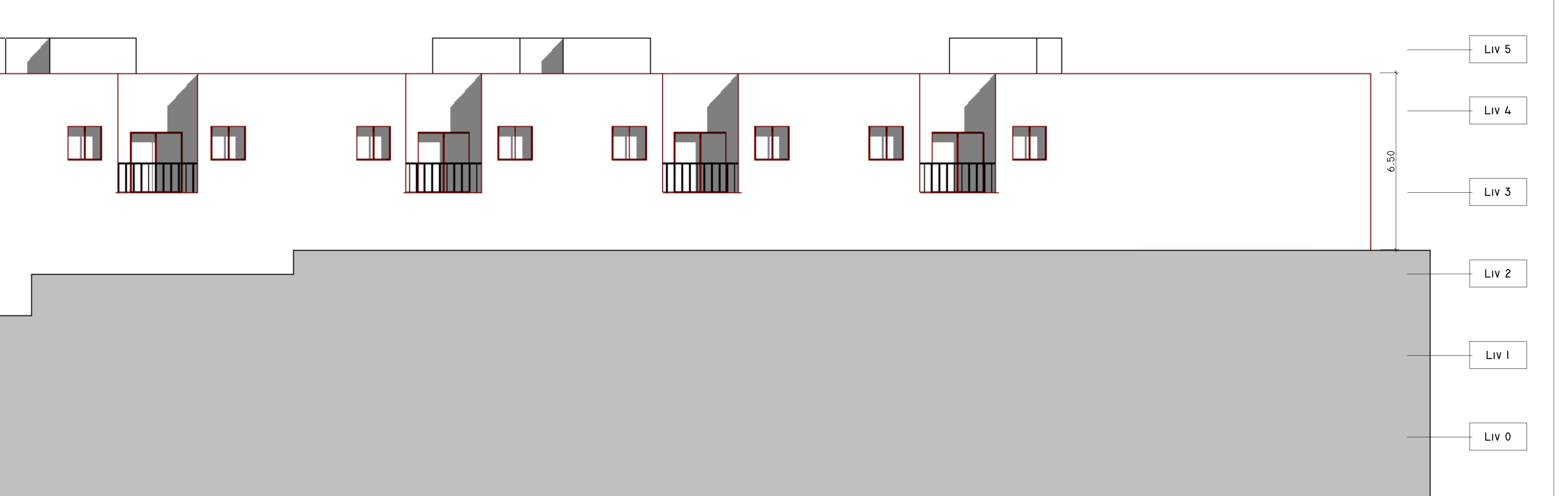
SUD EST 1 : 100