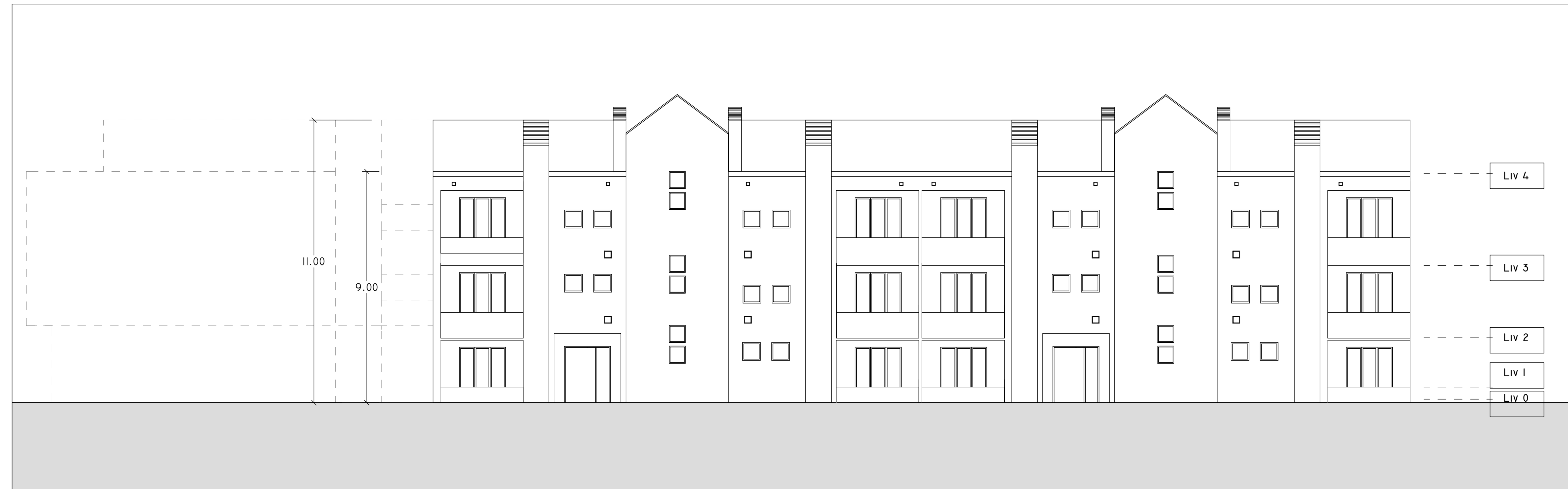
SUD 1 : 100

set-2020 0 architettura Plas Romano Saraceno -