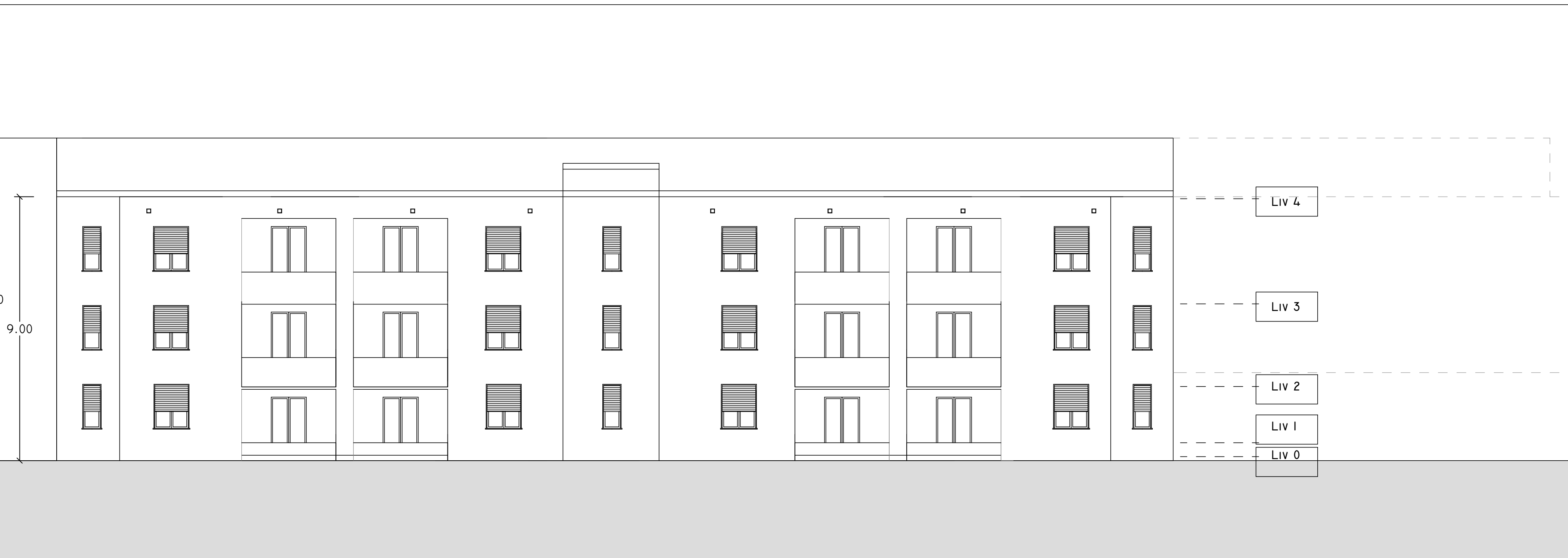
NORD 1 : 100