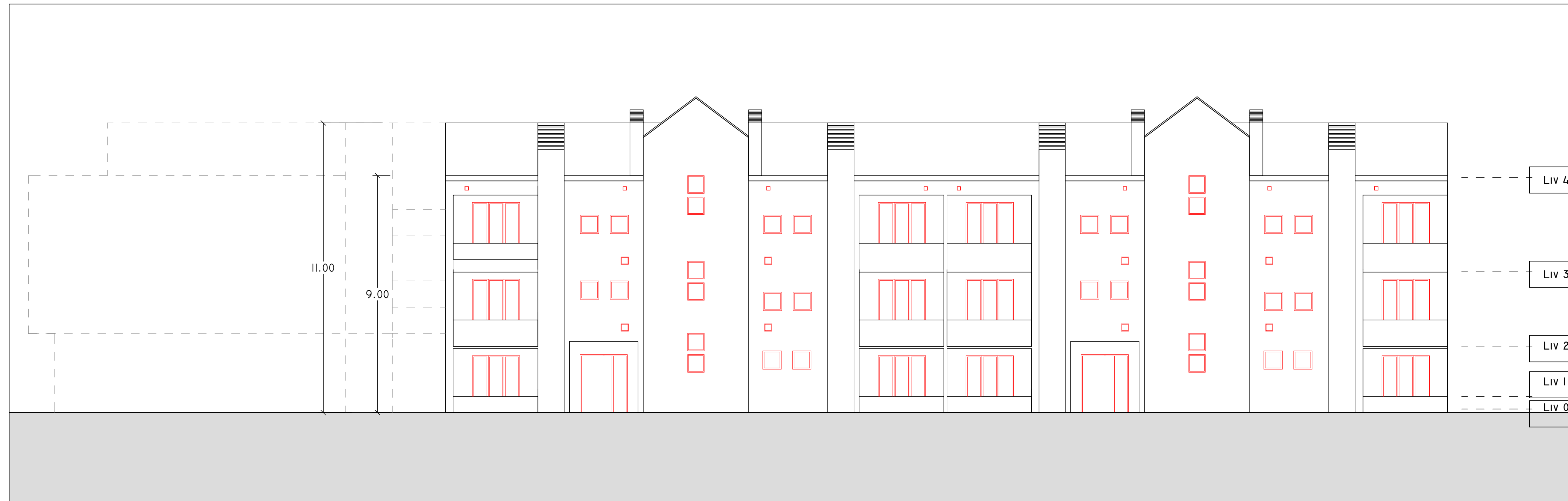
SUD 1 : 100

sec-2020 0 architettura Plus Romano Saraceno -