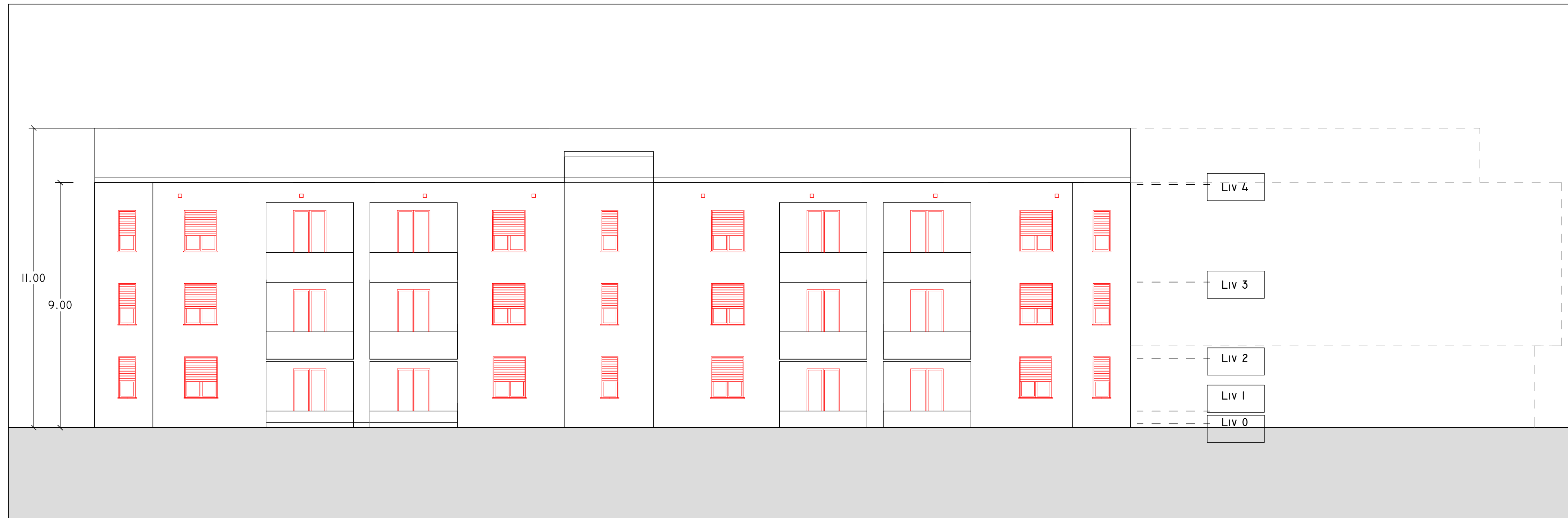
NORD 1 : 100