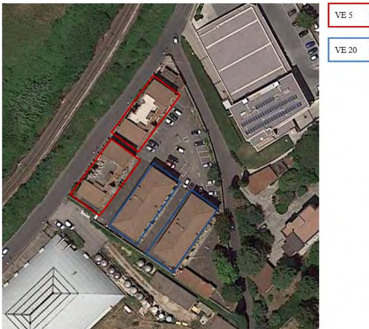
Figura 5. Individuazione delle Tipologie nel Lotto 3 – Comune di Velletri