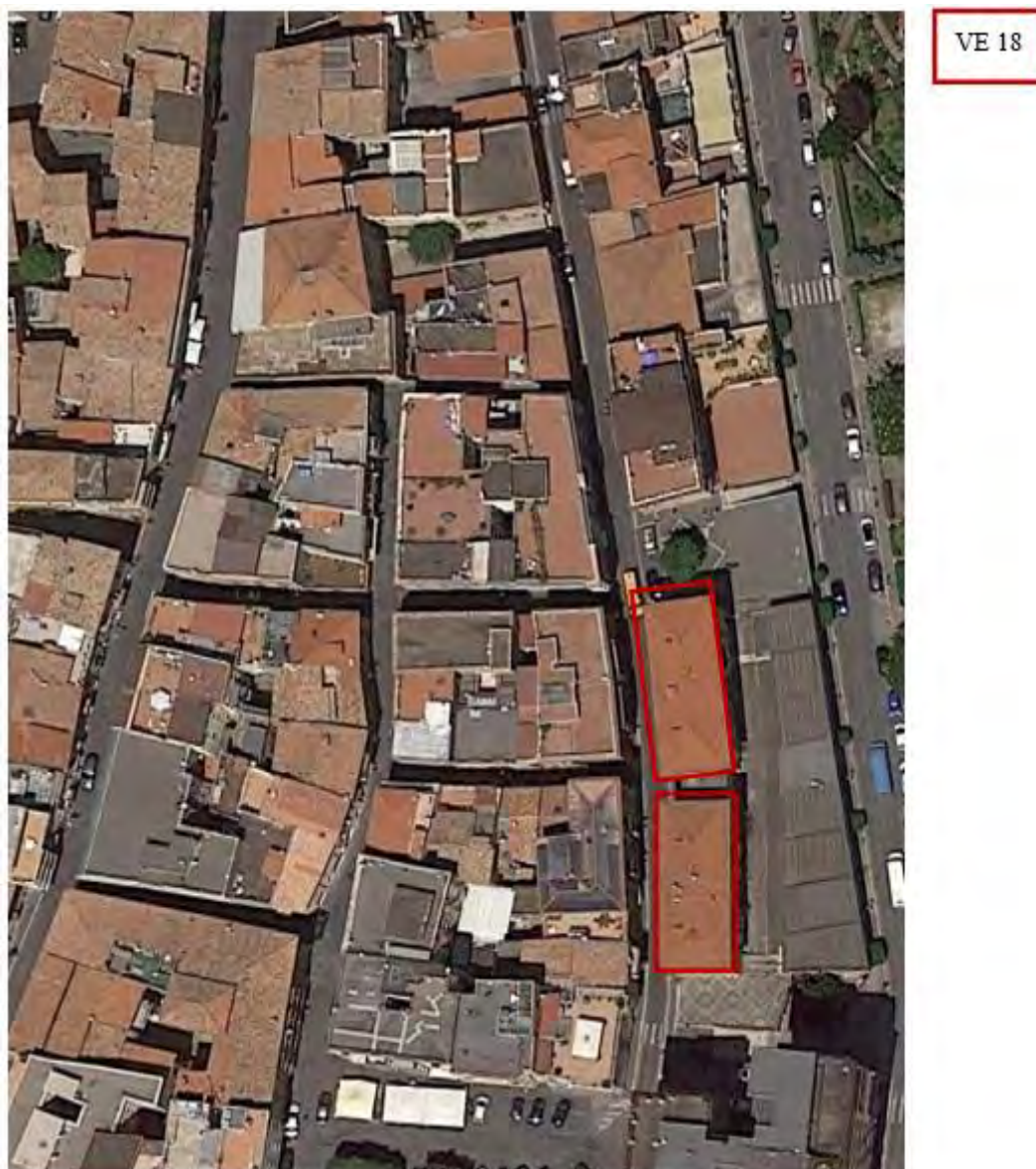
Figura 4. Individuazione delle Tipologie nel Lotto 2 – Comune di Velletri