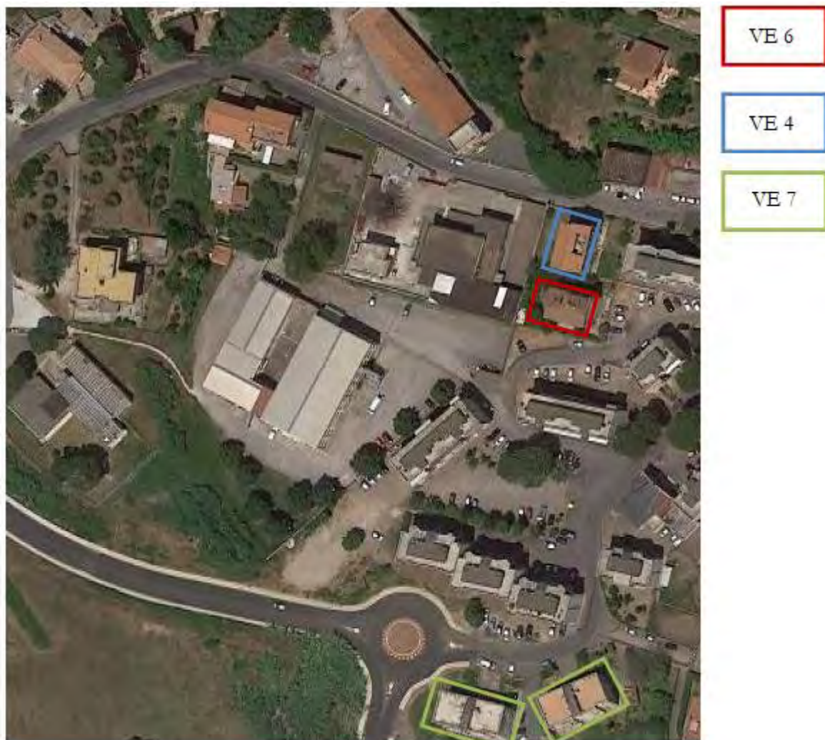
Figura 6. Individuazione delle Tipologie nel Lotto 4 – Comune di Velletri