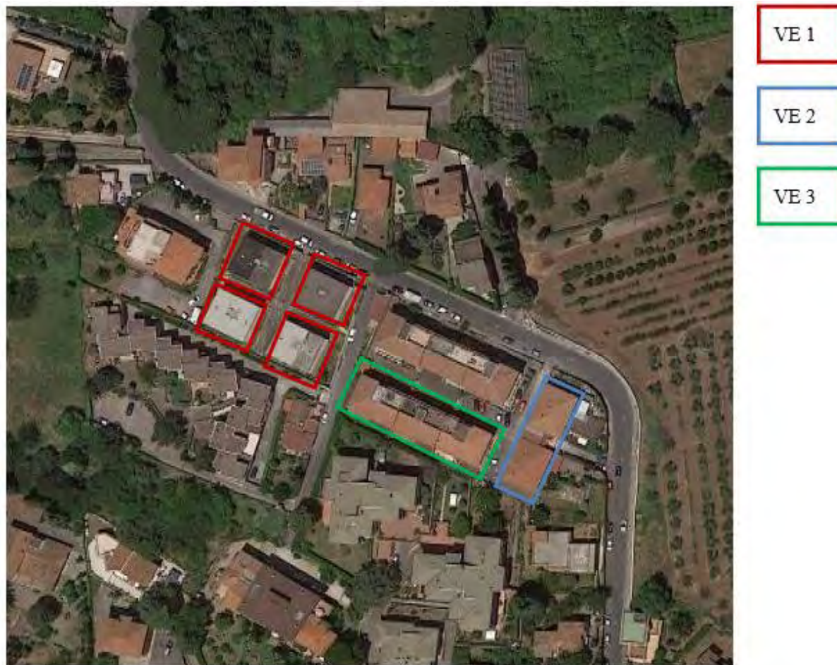
Figura 3. Individuazione delle Tipologie nel Lotto 1 – Comune di Velletri

Si riportano di seguito le immagini aeree con evidenziazione dell'ubicazione planimetrica delle tipologie individuate al paragrafo precedente: