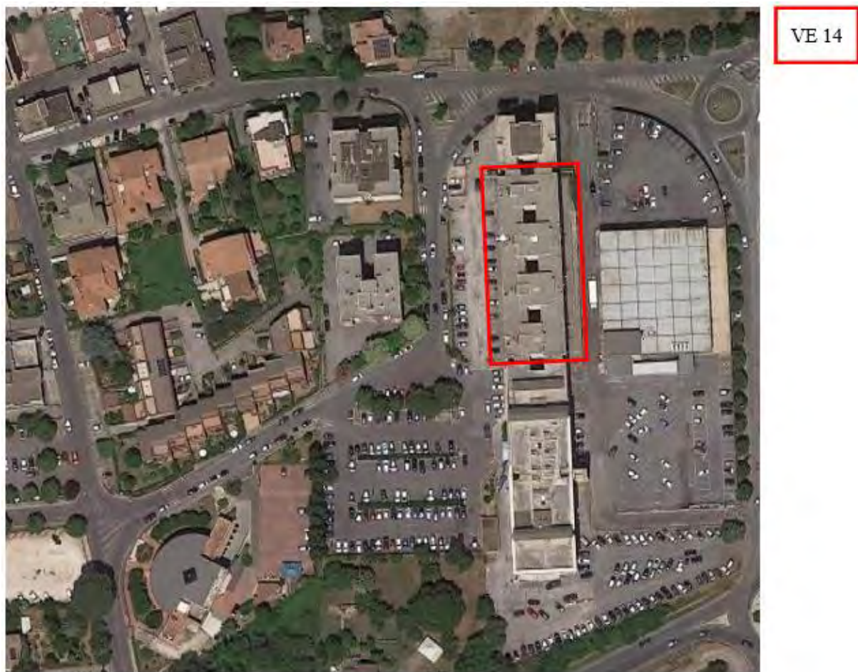
Figura 11. Individuazione delle Tipologie nel Lotto 9 – Comune di Velletri