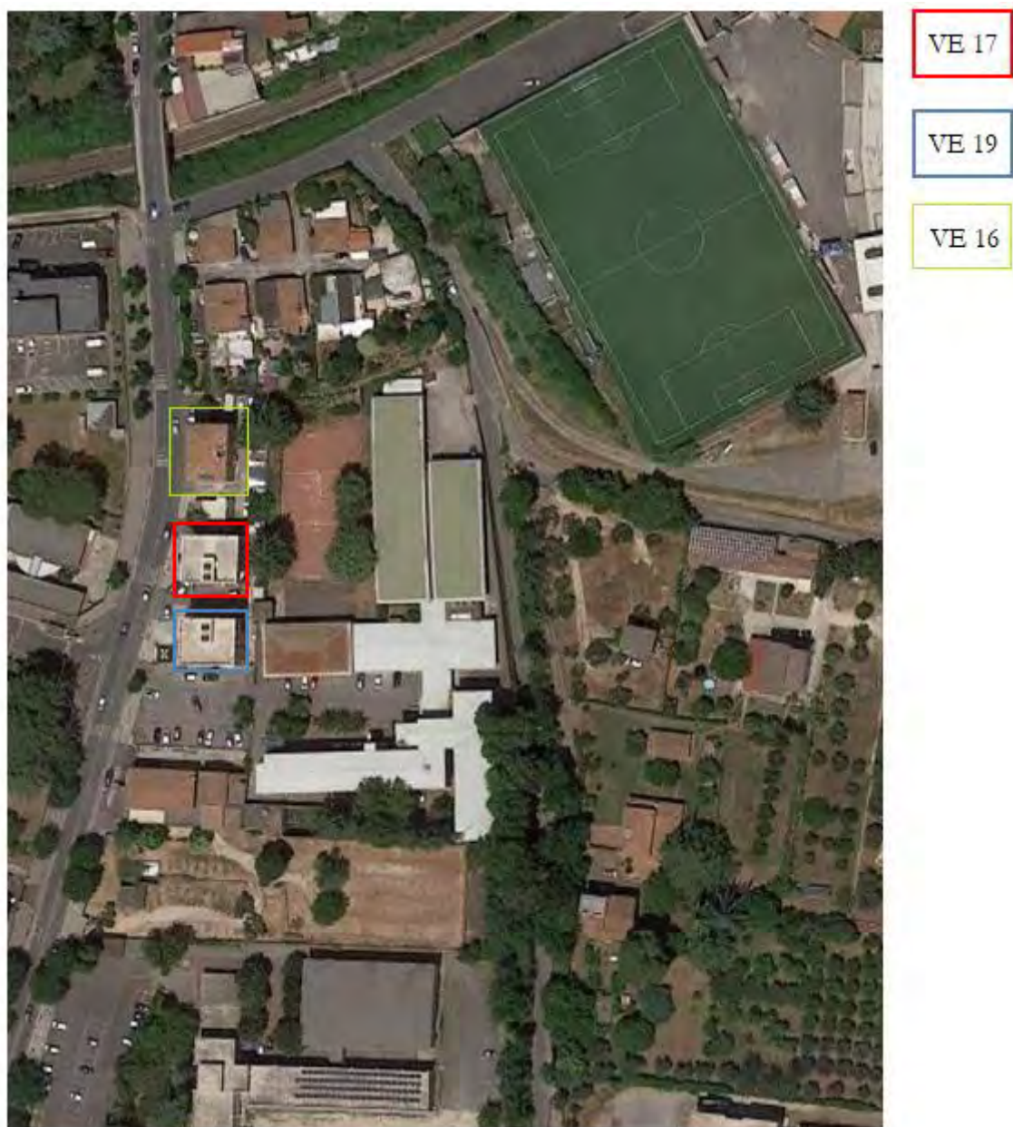
Figura 12. Individuazione delle Tipologie nel Lotto 10 – Comune di Velletri