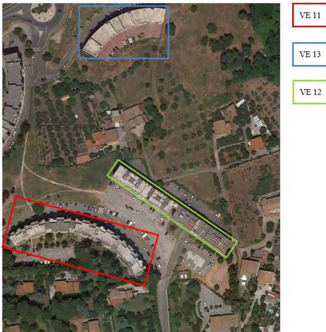
Figura 10. Individuazione delle Tipologie nel Lotto 8 – Comune di Velletri