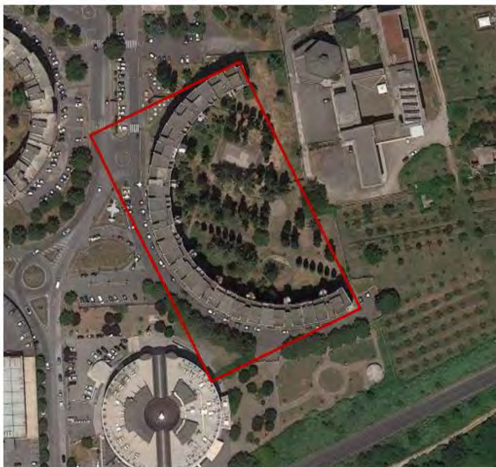
Figura 9. Individuazione delle Tipologie nel Lotto 7 – Comune di Velletri