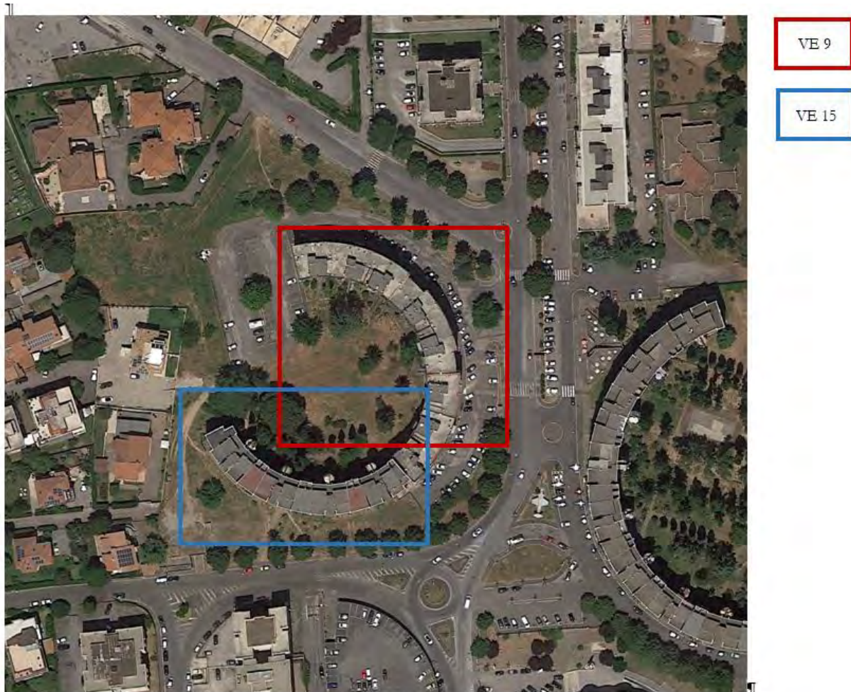
Figura 8. Individuazione delle Tipologie nel Lotto 6 – Comune di Velletri