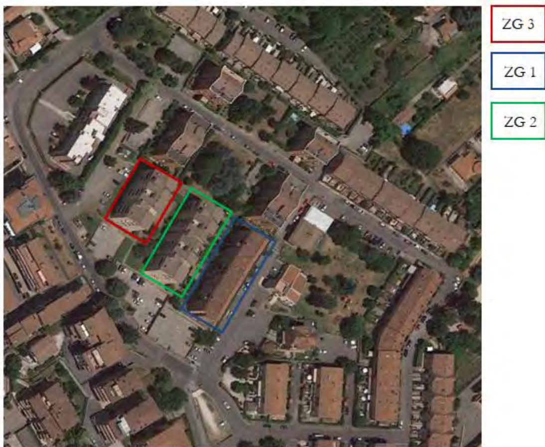
Figura 3. Individuazione delle Tipologie nel Lotto 1 – Comune di Zagarolo