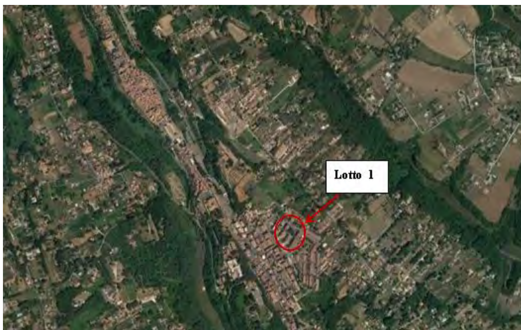
Figura 2. Individuazione dei lotti - Comune di Zagarolo su foto aerea