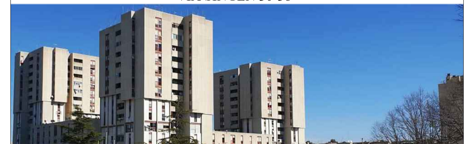
siti nel Comune di Pomezia, Via Singen, 30-38 Foglio 30, particelle 648

ai sensi dell'art. 4 del Decreto Legge n. 47 / 2014 "LAVORI DI EFFICIENTAMENTO ENERGETICO DEI FABBRICATI SITI NEL COMUNE DI POMEZIA, VIA SINGEN 30-38 "